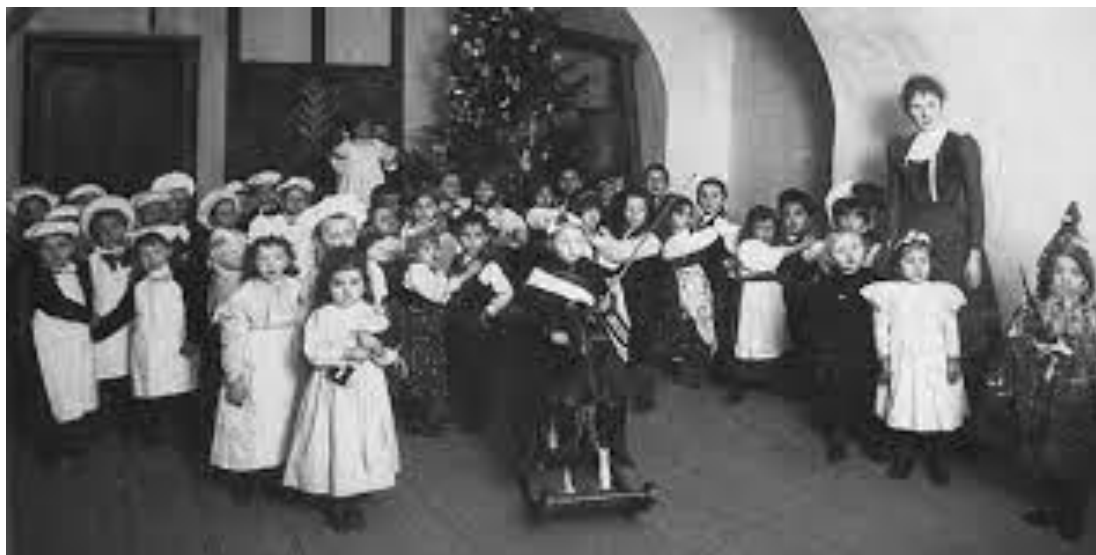
Slika 1. Mladež Gornjografskog zabavišta u Zagrebu za božićne svečanosti, Zagreb, oko 1900 ( Hrvatski školski muzej ).

Tek kasnije otvarale su se ustanove koje su imale ne samo socijalni nego i obrazovni cilj. One su uključivale pjestovališta, hranilišta, dječje domove i skloništa. Pjestovališta i hranilišta bile su ustanove koje su primale djecu već nakon navršenih dva tjedna starosti sve do treće godine života, to jest pjestovališta i hranilišta su upravo ono što se danas naziva jaslicama. 1855. otvoreno je prvo pjestovalište u Zagrebu, a njegovi osnivači su nadbiskup Juraj Haulik i dobrotvorno zagrebačko Gospojinsko društvo koje je bilo zaduženo za skrb djece u pjestovalištu (Serdar, 2013).