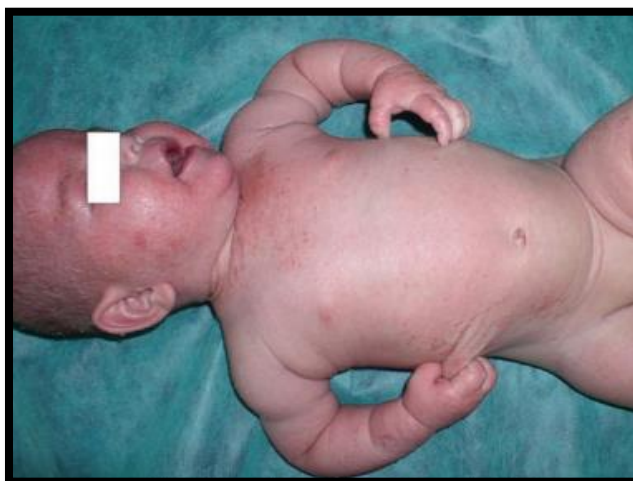
Slika 5.: Atopijski dermatitis (izražen svrbež) kod novorođenčeta

Izvor: Murat - Sušić, S., Atopijski dermatitis u djece – dijagnoza i liječenje , Medicus, Vol. 16 No. 1_Dermatologija, 2007., str. 14., dostupno na: www.hrcaak.srce.hr (21.08.2022.)