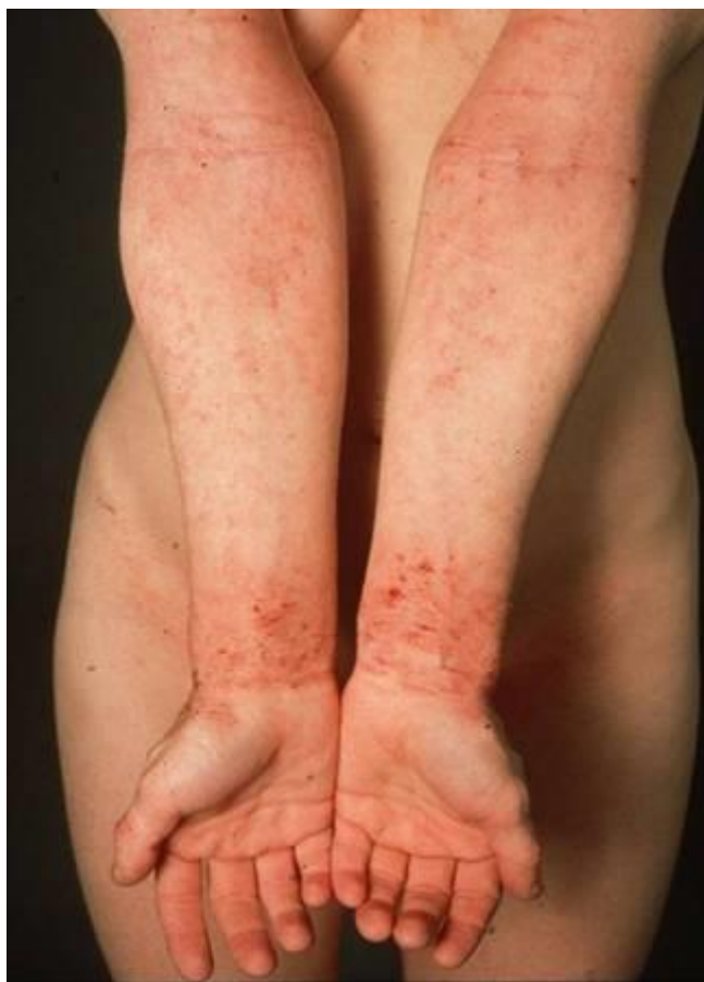
Slika 3.: Atopijski dermatitis kod djece (na tijelu)