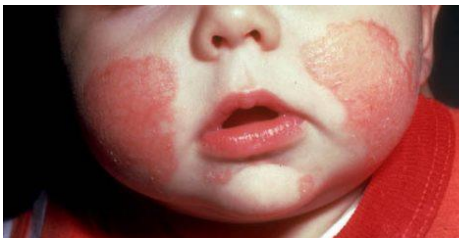
Slika 2: Atopijski dermatitis kod dojenčadi (na licu)