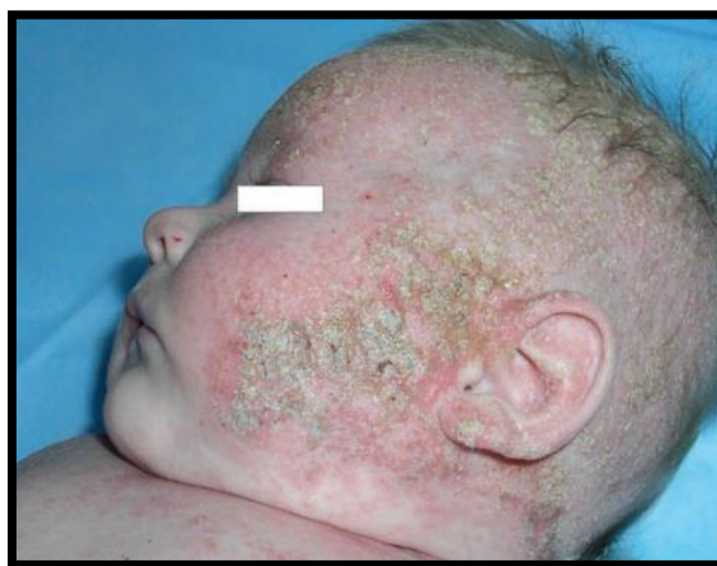
Slika 4.: Infekcije uzrokovane bakterijama, gljivicama, virusima

Na slici 4. se vidi se da je koža duboko inficirana. Bakterija koja je značajna za pojavu simptoma na vratu, licu, vlasištu, te u nosu djece naziva se Staphylococcus aureus , a da bi se smanjila infekcija od iste potrebno je ukloniti toksine stafilokoka na zahvaćenim područjima, posebno na području nosa.