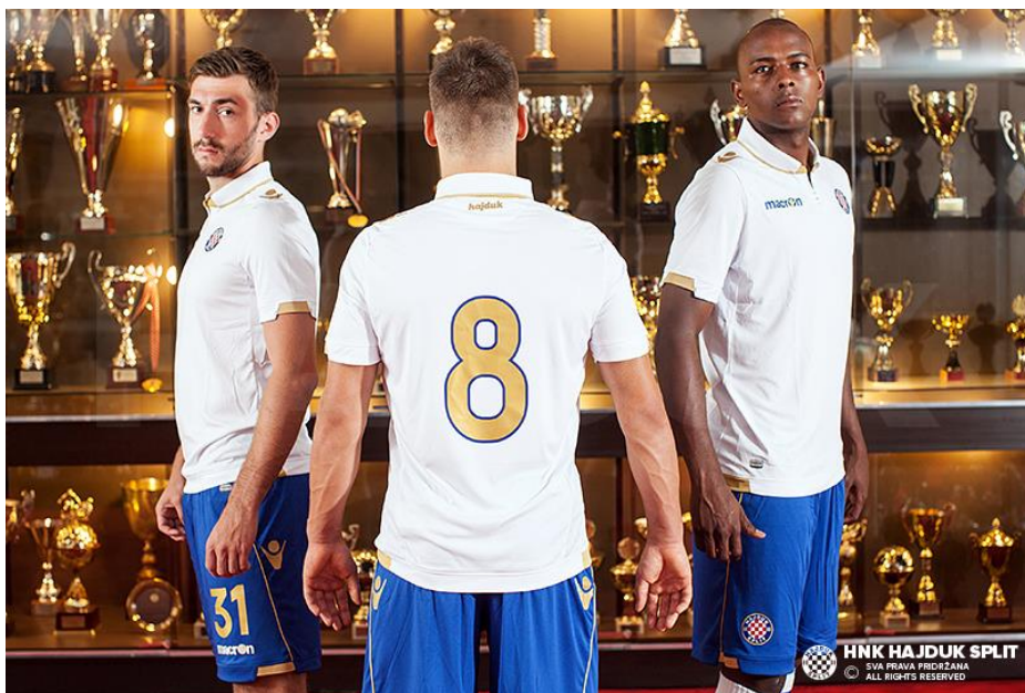
Slika 6: Dres Hajduka 2016. godine

Na prvim utakmicama igrači Hajduka su imali crveno-bijele pruge okomito kombinirane, kao simbol hrvatskoga grba. Dres je kasnije imao crvenu boju kao simbol Hrvatske, plavu boju kao simbol mora i Dalmacije, a bijelim slovima je ispisano Hajduk. Opet simbolično, kasnije se koristi ponajviše bijela boja na dresovima, u kombinaciji s plavim hlačama i čarapama, simbol jedara na moru, i od tada Hajdukovi igrači imaju naziv bili , odnosno bijeli .