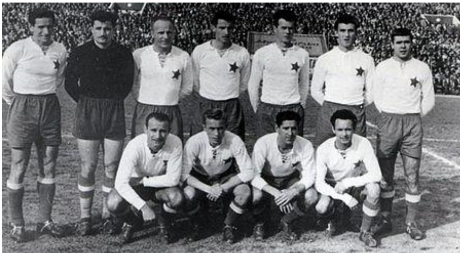
Slika 4: Momčad Hajduka 1954./55. godine