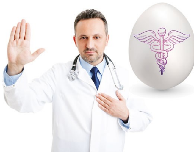
Slika 4 Profesionalna etika liječnika