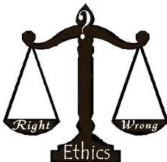
Slika 1 Osobna etika