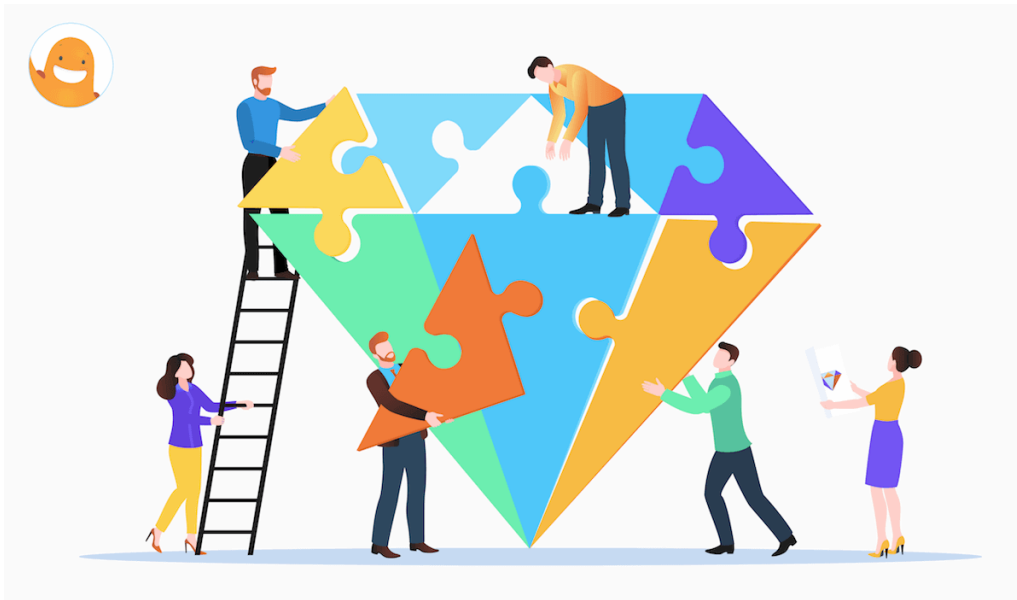
Slika 3 Organizacijska etika