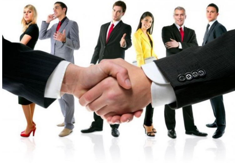
Slika 2 Radna/poslovna etika