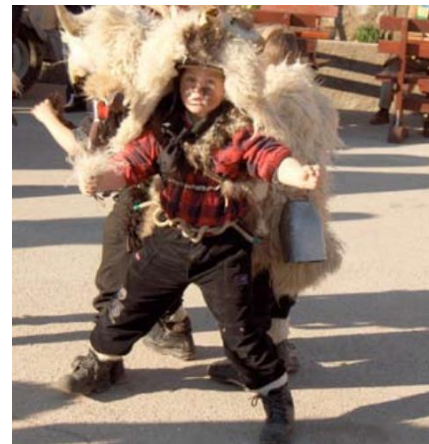
Slika 1. Grobnički mići dondolaši.

U tu svrhu koristili su zvona, čegrtaljke i druga priručna sredstva. No, zvuk zvona je, unatoč njihovom zastrašujućem izgledu zbog maski i odjeće koje su nosili te različitih alata (sjekira, štap i dr.) koja su imali, bio presudan u ostvarenju njihova nauma. Na Grobniku je to bio zvuk Dondolo (zvona), a oni koji su ih nosili dobili su naziv Dondolaši . Iako se tijekom vremena običaj "dondolanja" izgubio pod pritiskom društvenih promjena i industrijalizacije, običaj se zadržao tijekom maškara. Dondolaši nose na leđima veliko zvono, a kretnjama tijela u koreografiji, parovi dondolaša (Slika 1) stvaraju zvukove zvona.