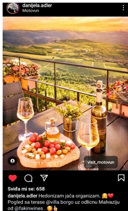
Slika 3. Primjer digitalnog marketinga na Instagramu