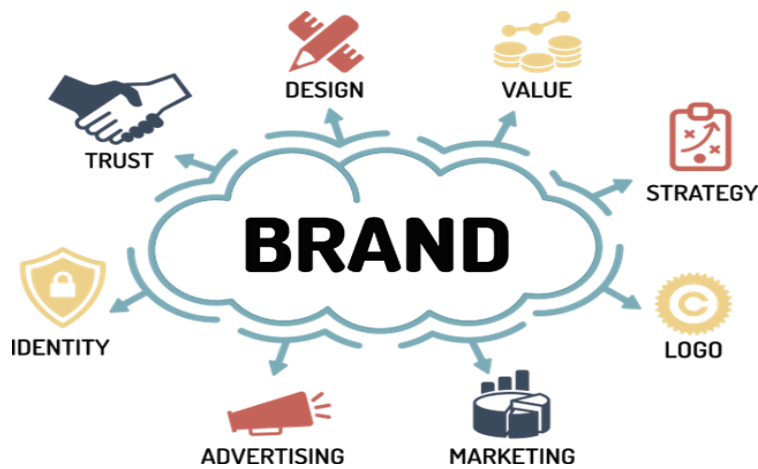
Slika 2. Sastavnice branda