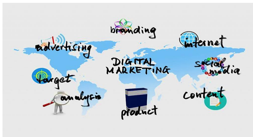
Slika 1. Sastavnice digitalnog marketinga