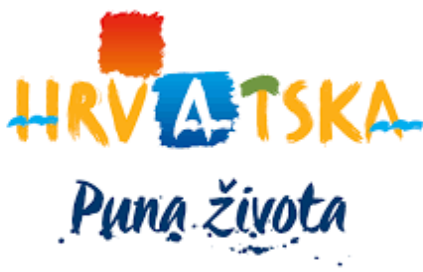
Slika 4. Logo Hrvatske turističke zajednice