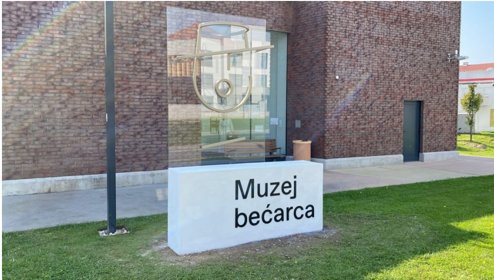
Slika 12. Muzej bećarca