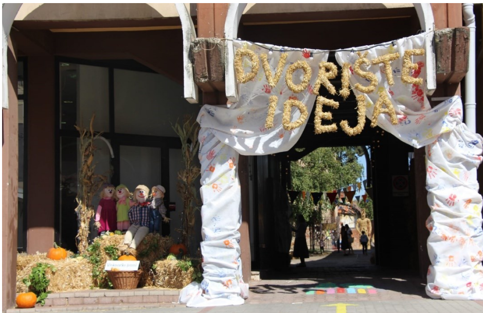
Slika 31. Dvorište ideja