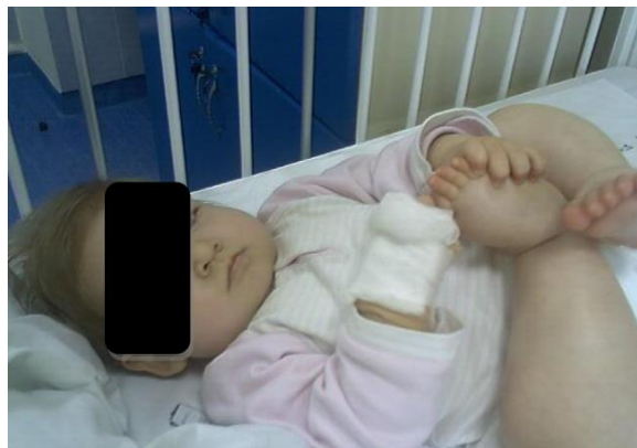
Slika 2 Dijete s nefrotskim sindromom

Kada je dijagnoza nefrotskog sindroma potvrđena provode se dodatne analize kako bi se utvrdilo je li riječ o idiopatskom ili sekundarnom nefrotskom sindromu. Kao i sve bolesti tako i nefrotski sindrom ima moguće komplikacije. Najčešće su: povećan rizik od infekcije, tromboza dubokih vena, pothranjenost, malnutricija u djece, anemija, kardiovaskularne bolesti, bubrežno slabljenje i koštane promjene u svim uzrastima. Ukoliko postoji infekcija, potrebno ju je liječiti prije početka terapije steroidima. U nefrotskom sindromu veliki je rizik od različitih infekcija, pa su prevencija, rano otkrivanje i liječenje vrlo bitni jer infekcija može dovesti do relapsa do tada dobro kontrolirane bolesti. (Batinić i sur., 2015.)