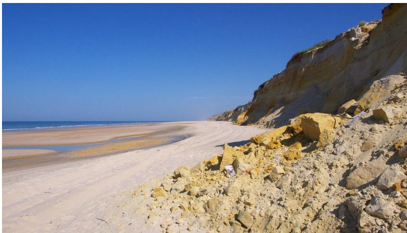
Slika 2: Acantilado del Asperillo