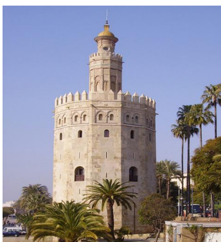
Slika 12: Torre del Oro