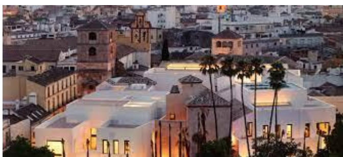
Slika 13: Picassov muzej