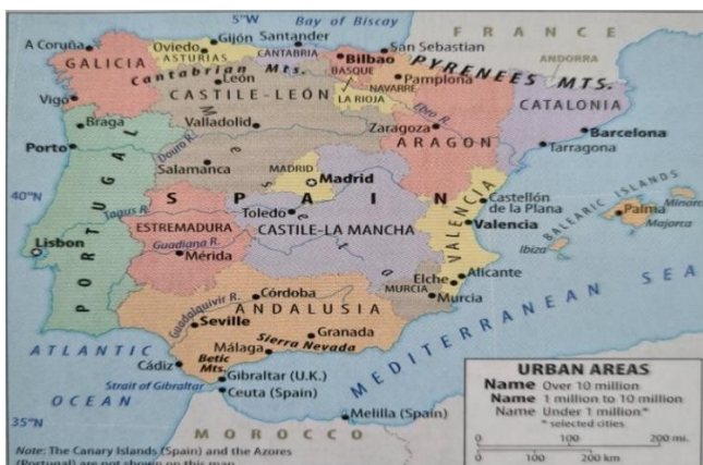
Karta 1: Geografski položaj Andaluzije