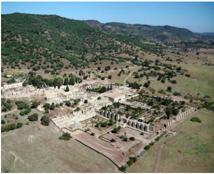
Slika 7: Ostatci kalifatskog grada Medina Azahara