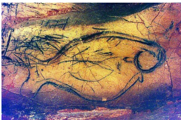
Slika 3: Crtež ribe na zidu špilje Pileta