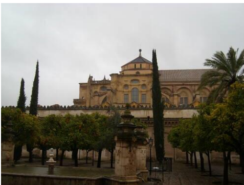
Slika 8: Velika džamija u centru Córdoba