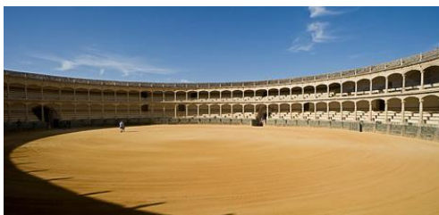
Slika 11: Plaza de Toros de Ronda

Izvor: https://www.andalucia.org/en/ronda-cultural-tourism-plaza-de-toros-de-ronda (posjećeno 02.06.2021.)