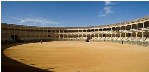
Slika 11: Plaza de Toros de Ronda