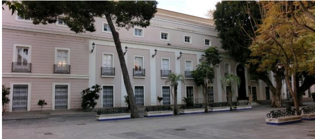
Slika 14: Zgrada Muzeja u Cádiz