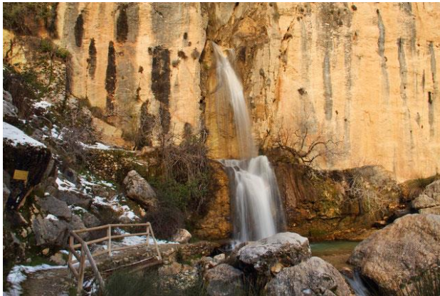
Slika 4: Vodopad La Magdalene