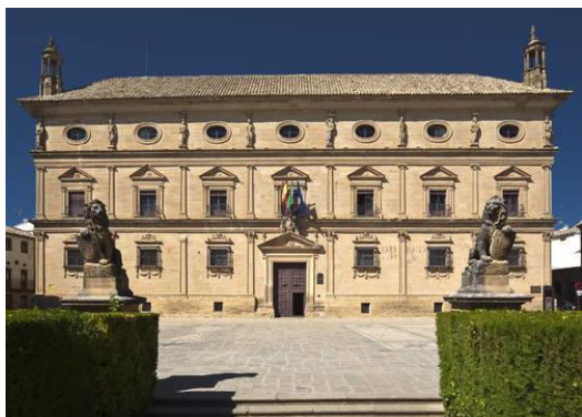
Slika 9: Palača Vázquez de Molina u Úbedi