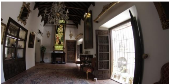
Slika 15: Izložba u Muzeju