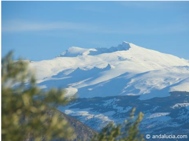
Slika 1: Bijeli vrhovi planinskog lanca Sierra Nevada