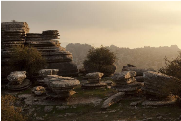
Slika 6: Iskopine dolemna u Antequeri