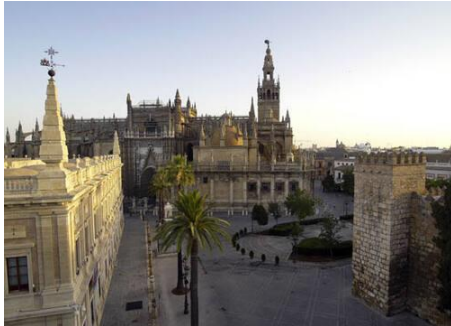
Slika 10: Katedrala Alcázar