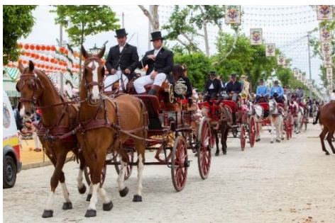
Slika 16: Parada kočija za vrijeme sajma