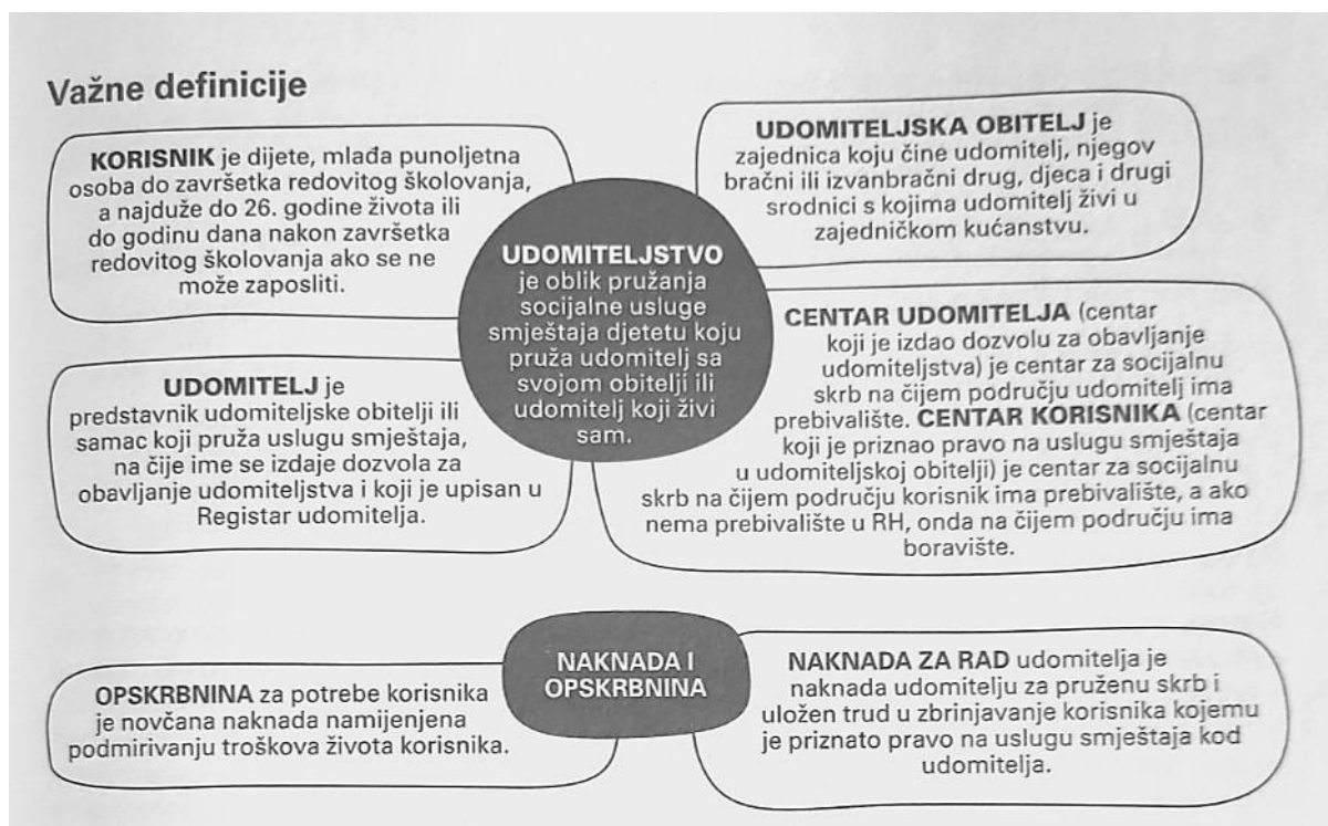
Slika 1. Važne definicije o udomiteljstvu (Miharija, 2021)

Udomiteljstvo se smatra prvim i najboljim oblikom skrbi koje može djelomično nadomjestiti obiteljsko okruženje i omogućiti skrb djeteta prema njegovim individualnim potrebama. Udomitelj je osoba koja predstavlja udomiteljsku obitelj ili samac, a na njegovo se ime izdaje dozvola za obavljanje udomiteljstva. Upisan je u Registar udomitelja. Udomitelj i njegov bračni ili izvanbračni drug, djeca te drugi srodnici s kojima živi u kućanstvu čine udomiteljsku obitelj.