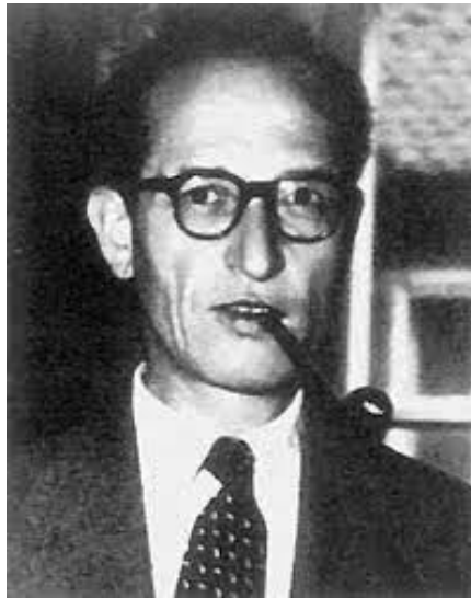
Slika 1. Slavko Zlatić u mladim danima