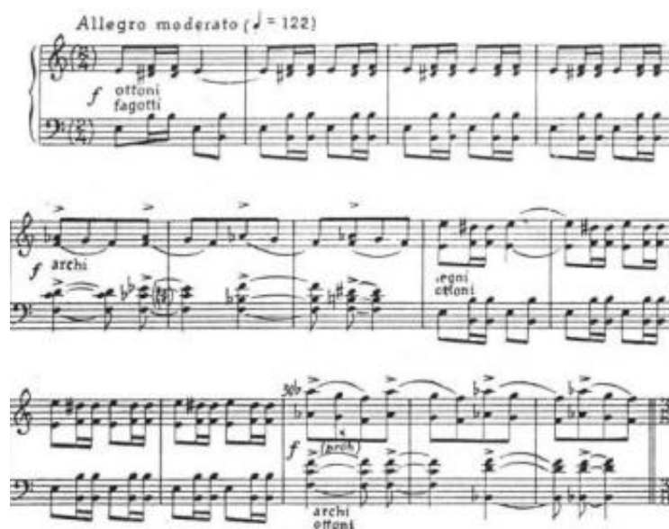
Slika 5. Simfonijski ples br. 2 (S. Zlatić)