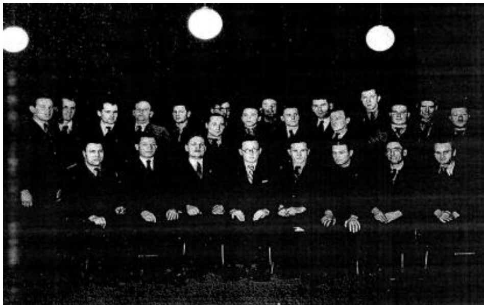
Slika 2. Pjevački zbor Jablan