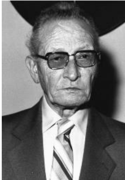
Slika 3. Hrvatski skladatelj Slavko Zlatić