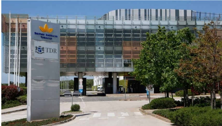
Slika 4. Glavni ulaz u tvornicu duhana TDR d.o.o.uKanfanaru