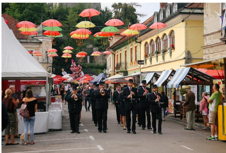
Slika 3: Dnevi Narodnih Noš, Kamnik

u gradu od samo 13.000 stanovnika (Dnevni Narodni Noš, službena stranica, 2023). Festival potiče domaće stanovništvo na sudjelovanje te ekonomsku korist kroz prodaju ručno rađenih radova i domaćih proizvoda. Uključuje izložbe, radionice i predstave koje prikazuju zamršene dizajne, žive boje i kulturni značaj tradicionalne slovenske nošnje. Slaveći slovensku tradicionalnu nošnju, pomaže u očuvanju i promicanju jedinstvenog kulturnog identiteta Slovenije. Festival Dnevi narodnih noš je međunarodni događaj koji okuplja ljude iz različitih zemalja i kulturnih sredina kako bi podijelili svoja znanja, iskustva i tradiciju. Pruža platformu za kulturnu razmjenu i dijalog, pomažući u promicanju međusobnog razumijevanja i poštovanja među ljudima različitih kultura. Poticanjem kulturne razmjene, pomaže u stvaranju raznolikijeg, tolerantnijeg i međusobno povezanog svijeta.