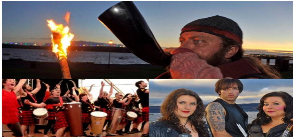
Slika 4: Largs Viking Festival, Sjeverni Ayrshire

niz događaja, uključujući povijesne rekonstrukcije, glazbu, ples i pripovijedanje, koji pomažu oživjeti škotsku vikinšku prošlost. Slaveći škotsku i vikinšku povijest, pomaže u očuvanju i promicanju jedinstvenog kulturnog identiteta Škotske.