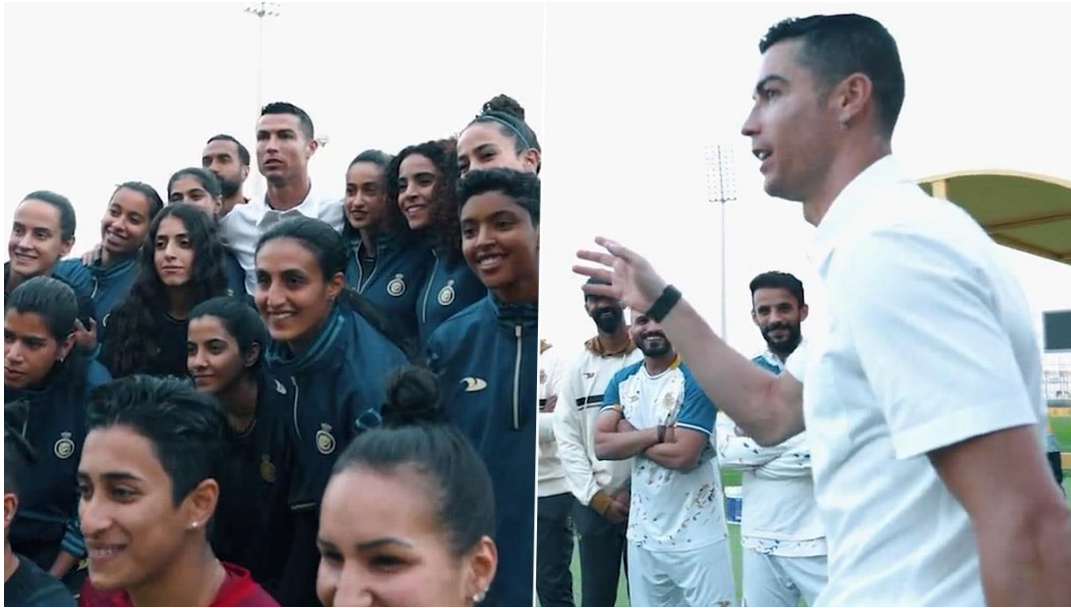
Slika 5. Cristiano Ronaldo i ženska nogometna reprezentacija Al-Nassra