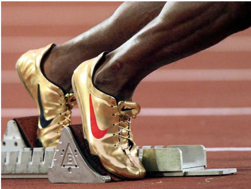
Slika 10. NIKE Zlatne cipele Michaela Johnsona