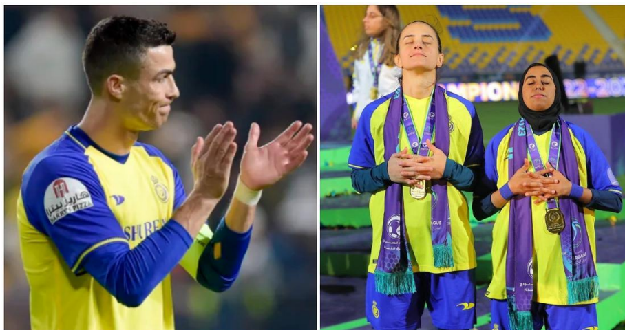
Slika 6. Ženska nogometna reprezentacija kopira Ronaldovo slavlje nakon osvojenog prvog mjesta