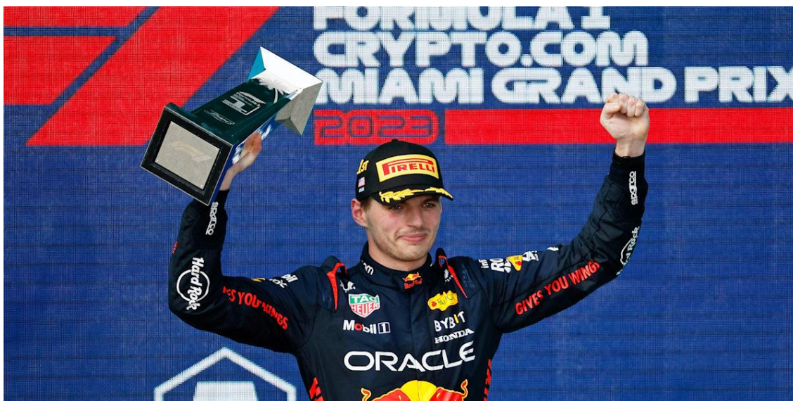
Slika 7. Miami Grand Prix 2023 - pobjednik Max Verstappen