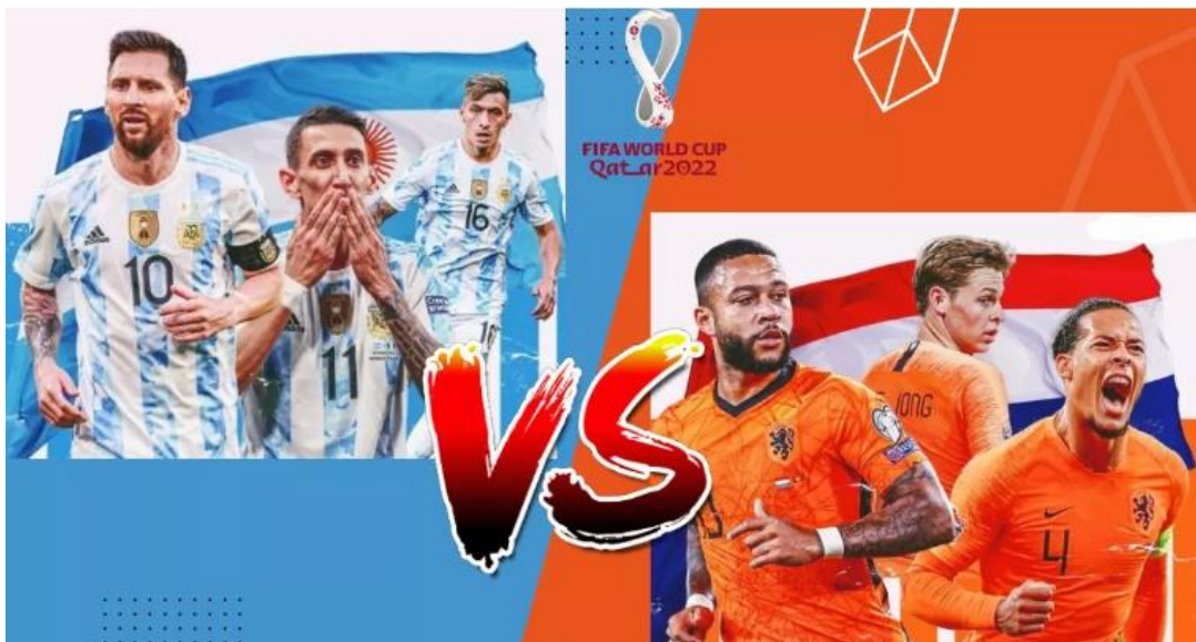
Slika 8. FIFA Svjetsko prvenstvo u Kataru 2022. Argentina i Nizozemska