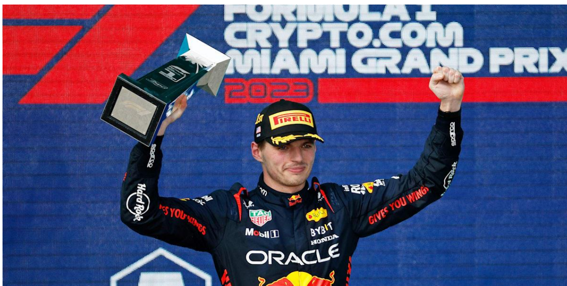
Slika 7. Miami Grand Prix 2023 - pobjednik Max Verstappen