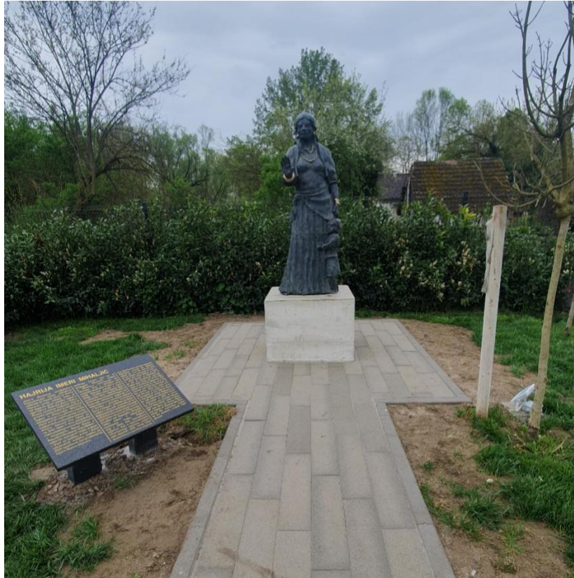
Slika 8. pravednica među narodima, Hajrija Imeri Mihaljić

romskog jezika. Nakon nekog vremena ispostavilo se da je učiteljica Esterina majka koja ju je tada posvojila. Ester je i dalje živa. U nastavku slijedi fotografija kipa akademskog kipara Marina Marinića koja prikazuje Pravednicu među narodima, Hajriju Imeri Mihaljić.