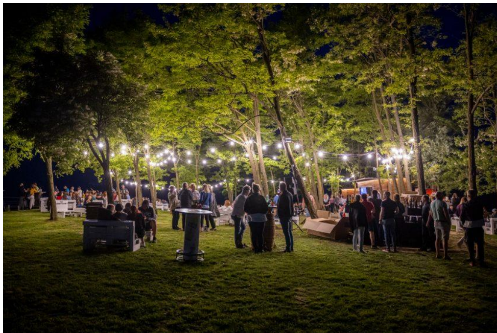
Slika 3 Mađerkin breg kao atrakcija

Izvor: Vinarija Štampar, https://vinarija-stampar.hr/maderkin-breg/ , 1.6.2023.