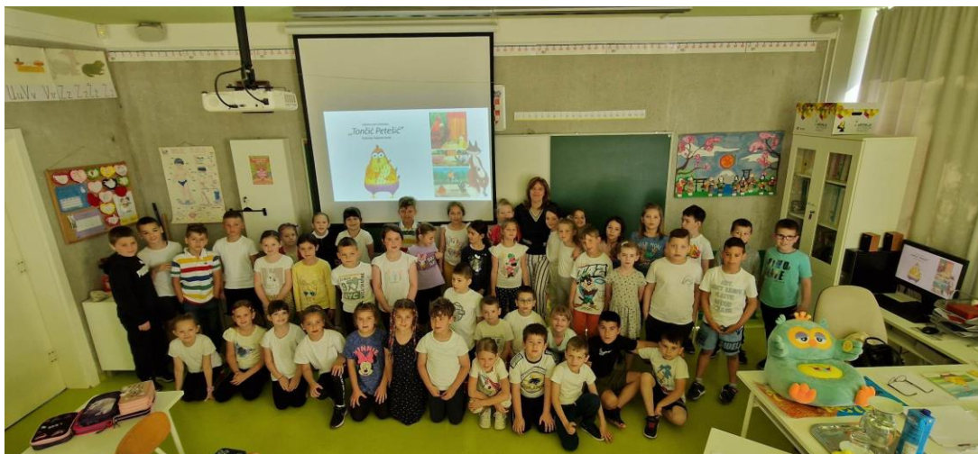
Slika 3 do 4: Crteži prvašića na temu slikovnice Tončić Petešić (Dostupno na: http://os-veli-vrh-pu.skole.hr/?news_id=2463 ; Pristupljeno: 16. kolovoza 2023.)