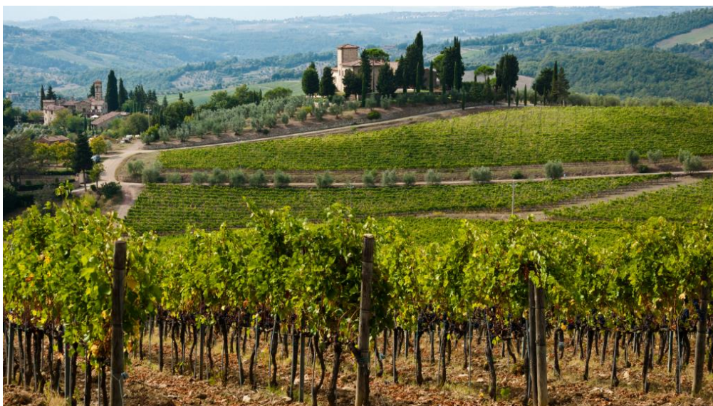
Slika 1. Chianti regija, https://www.palateclub.com/chianti/