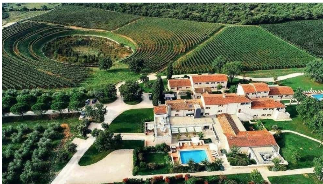
Slika 4. Meneghetti hotel, https://sofiaadventures.com/croatian-wineries/croatia-istria-meneghetti-winery/

Stručnjaci za wellness u Meneghetti Wine Hotelu & Winery stvorili su iskustva inspirirana duhom Mediterana, crpeći blagodati terapije lokalnim biljem. Posebno prepoznatljivi tretmani koje nude posjetiteljima uključuju vinoterapiju i terapiju maslinovim uljem izrađenim od vlastitih proizvoda. Sastojci poput grožđa i maslina hrane, hidratiziraju i pomlađuju kožu, ostavljajući je mekom i elastičnom. Također, na raspolaganju su i druge aktivnosti poput planinarenja, brdskog biciklizma, biciklizma, jahanja konja, obilaska povijesnog centra, piknika u vinogradu i još mnogo toga.