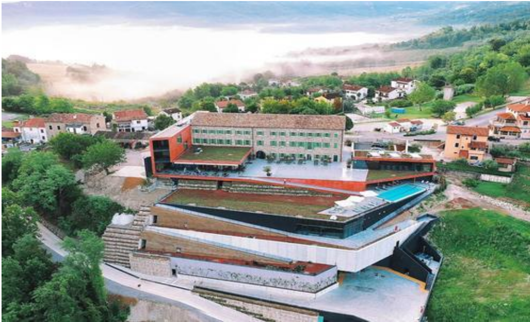
Slika 5. Roxanich hotel i vinarija, https://www.kayak.com/Motovun-Hotels-Wine-Heritage-Hotel-Roxanich.4595142.ksp

lokalnih farmera, uzgajivača i proizvođača. Tjestenina "fatta in casa e a mano" ručno se izrađuje u kući u tradicionalnim i internacionalnim oblicima, a meso je domaćeg podrijetla, dok se riba iz Jadrana koristi u jelima.