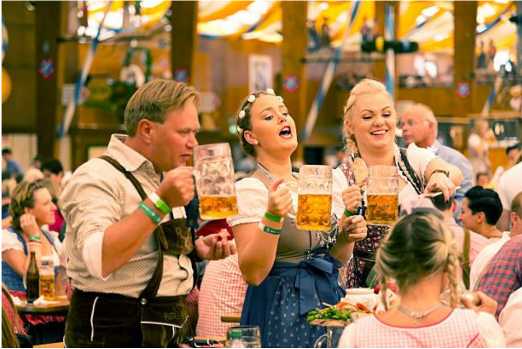
Slika 3. Oktoberfest u Munchenu