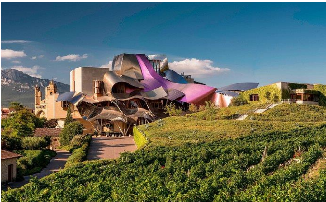
Slika 6. Hotel Marques de Riscal u Španjolskoj, https://www.marquesderiscal.com/

U hotelu Marques de Riscal svaki gost doživljava nevjerojatnu harmoniju umjetnosti, povijesti, prirode i luksuza. Ovo je mjesto koje će zauvijek ostati urezano u pamćenje kao jedinstveno iskustvo za sva osjetila.