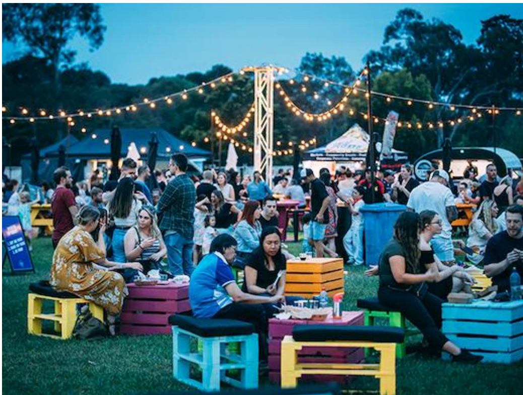
Slika 2. Ulični festival hrane u Melbourneu

Osim gastronomskog užitka, festival u Melbourneu pruža i raznolikost dodatnih sadržaja. Posjetitelji mogu sudjelovati u izradi vlastitog gina, prisustvovati uživo demonstracijama kuhanja ili se upustiti u kušanje japanskog specijaliteta - Sakea. Ovaj festival predstavlja izvanredno iskustvo koje zadovoljava sva osjetila, pružajući ne samo nevjerojatne okuse, već i obogaćujući edukativne i zabavne aktivnosti za posjetitelje svih dobnih skupina.