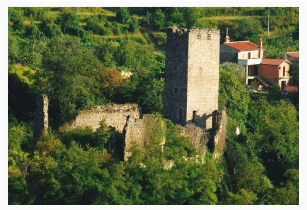
Slika 11. Kaštel Momjan