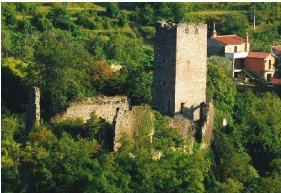
Slika 11. Kaštel Momjan