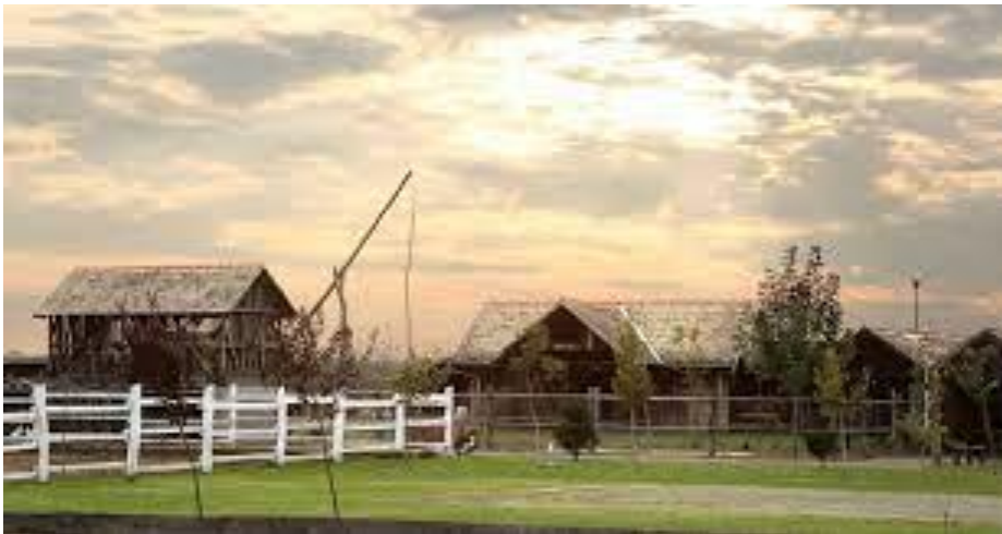
Slika 4. Acin salaš