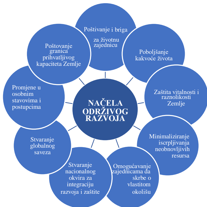
Slika 1. Načela održivog razvoja