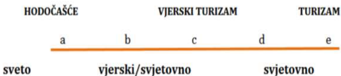
Slika 2. Korelacija hodočasnik – turist

Izvor: Smith, V. L. (1992.) Introduction: The Quest in Guest. Annals of Tourism Research. Vol. 19. No. 1. Str. 4.