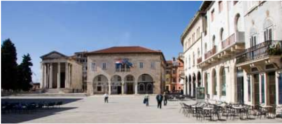
Slika 5. Forum

i hram cara Augusta i Rome, pored njih se nalazilo i Dijanino kupalište. Danas na trgu možemo vidjeti naslage skoro svih povijesnih i graditeljskih razdoblja Pule. 6