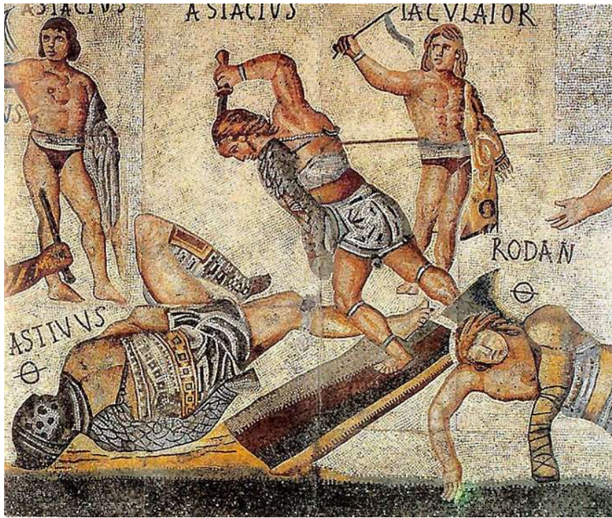
Slika 3. Gladijatori, izvor: https://www.enciklopedija.hr/