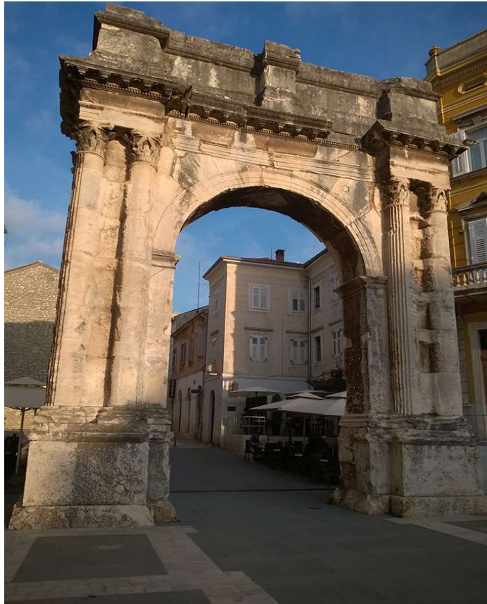
Slika 8. Slavoluk Sergijevaca