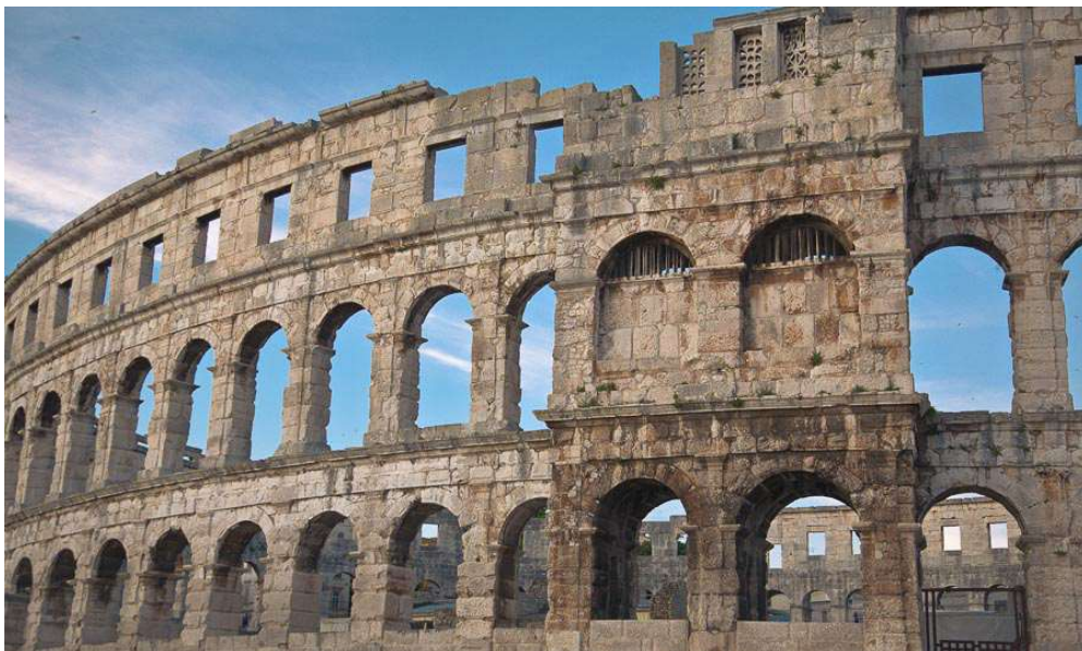
Slika 1. Arena-Amfiteatar