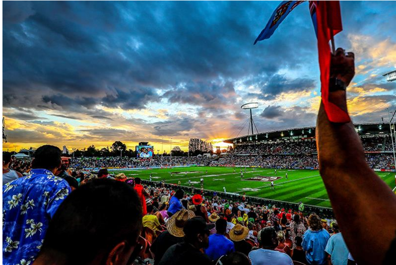
Slika 25. Stadion Waikato