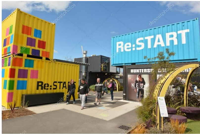
Slika 22. Re:START Mall- trgovački centar