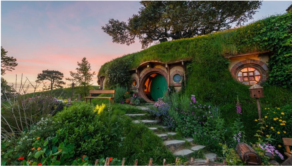
Slika 24. Hobbiton Movie Set