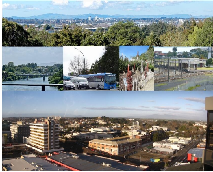
Slika 23. Grad Hamilton