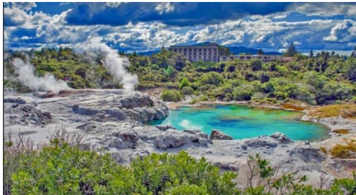
Slika 12. Regija Rotorua