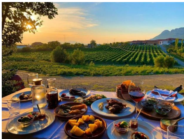
Slika 15. Prezentirana jela restorana Mrizi i Zanave , Albanija