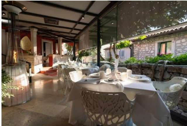
Slika 9. Restoran Monte , Rovinj