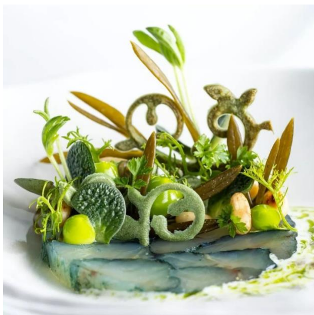
Slika 8. Jedna od delicija restorana Nebo , Rijeka