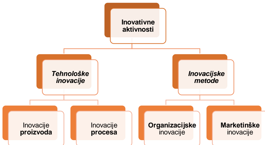
Shema 1. Vrste inovacija i inovativna aktivnost poduzeća