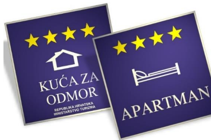
Slika 1. Kategorizacijske oznake ugostiteljskih objekata u Republici Hrvatskoj