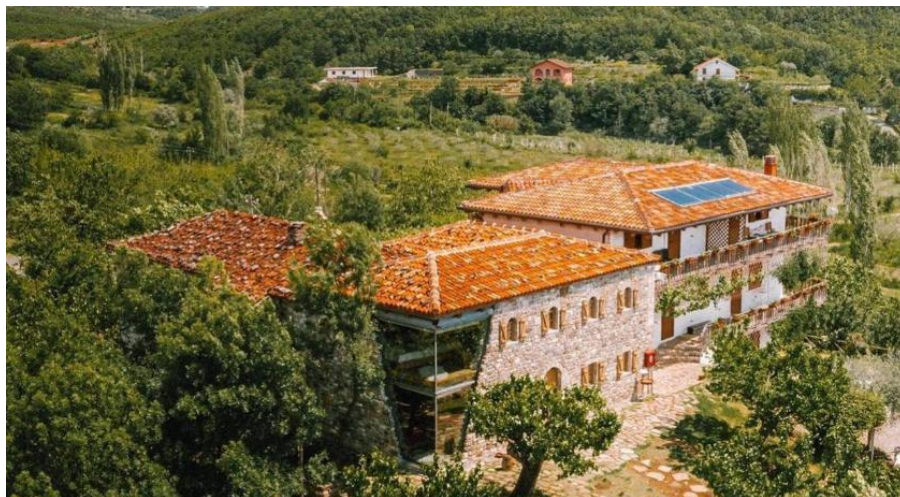
Slika 13. Restoran Mrizi i Zanave , Albanija