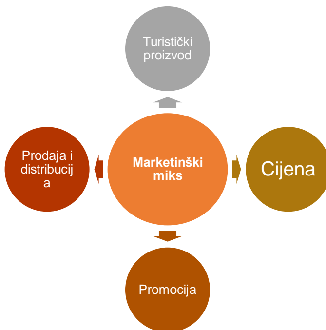
Shema 2. Instrumenti marketinškog miksa u turizmu - 4P