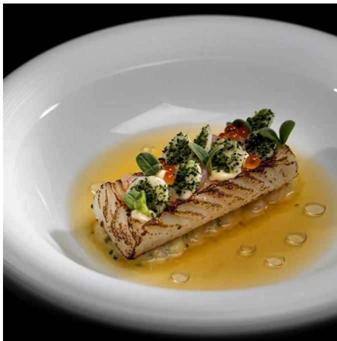
Slika 12. Jedna od delicija Restorana 360 , Dubrovnik