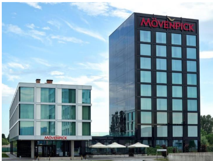
Slika 5. Mövenpick hotel, Zagreb