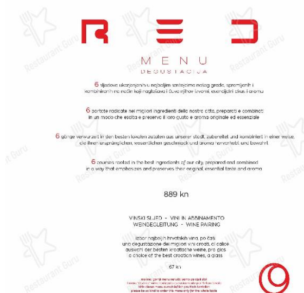
Slika 3. Primjer menua