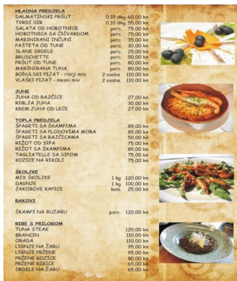
Slika 2. Primjer jelovnika

Izvor: Konoba "Bazilika" Biograd, jelovnik https://www.konoba-bazilika.com/index.php/hr/jelovnik?cookie_07b3e14a7eb12d6bf8501cea4d2167dd=accepted