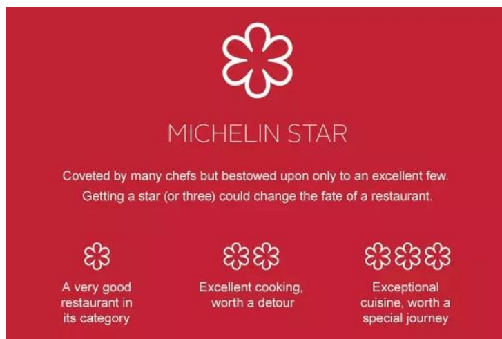
Slika 6. Oznake Michelin zvjezdica