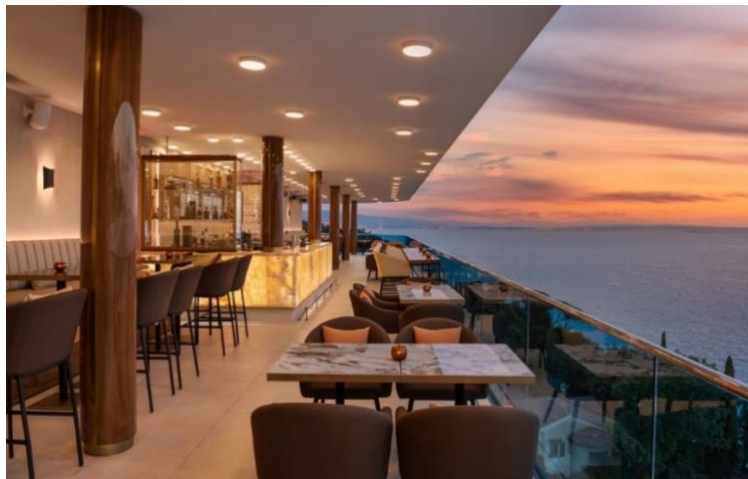
Slika 7. Restoran Nebo , Rijeka