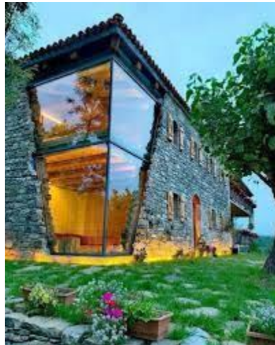
Slika 14. Kuhinja restorana Mrizi i Zanave , Albanija