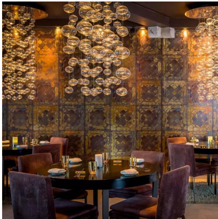
Slika 11. Restoran 360 , Dubrovnik