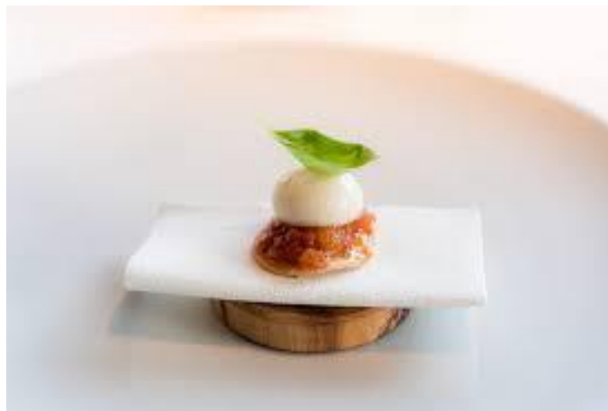
Slika 10. Jedna od delicija restorana Monte , Rovinj