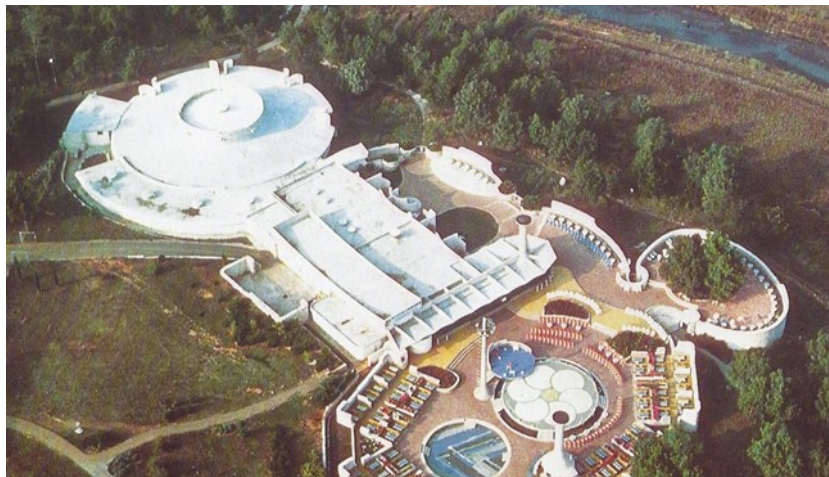
Slika 4: International club-INTER.

Plava laguna u cilju privlačenja, ali i zadržavanja stalnih gostiju uviđa potrebu organiziranja zabavnih programa. Na terasi kamp-hotela odvijaju se glazbene i plesne večeri. Turističko poduzeće Riviera slijedi njihov primjer te na terasu hotela Riviera dovodi poznate zagrebačke pop bendove. Nedugo nakon organizacije zabavnih večeri za goste uviđa se potreba za izgradnjom većeg noćnog kluba gdje bi se osim gostiju moglo zabavljati i lokalno stanovništvo. Godine 1968. na ulasku u turističko naselje Zelena laguna gradi se International club-INTER, koji kasnije biva preimenovan u Byblos (sl. 6.).