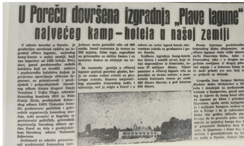
Slika 3: Izgradnja kamp-hotela Plava laguna.

restoranom. U šatorima i bungalovima moglo je boraviti oko 800 turista željnih što bližeg kontakta s prirodom. Izgradnja tada jednog od najljepših europskih kampova stajala je francusko poduzeće više od 97 milijuna jugoslavenskih dinara.