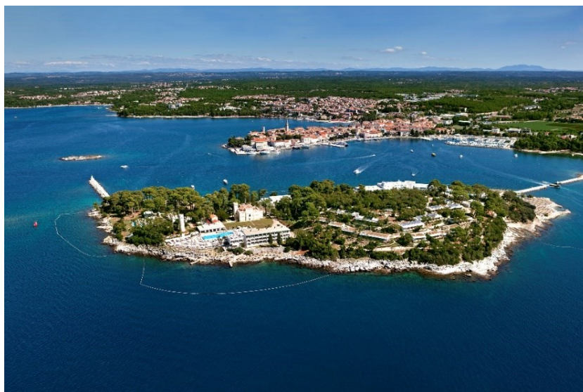
Slika 6: Otok sv. Nikola.

Osamdesetih se nadograđuju se postojeći smještajni kapaciteti, ali se i nastavlja izgradnja novih objekata. Na otoku Sv. Nikola 1985. se dvorac Izabela preuređuje u luksuzni smještajni objekt za goste dubljeg džepa. Godinu dana kasnije nedaleko dvorca izgrađen je hotel Fortuna, također u vlasništvu Riviere (sl. 7).