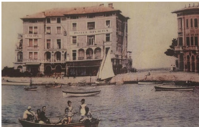
Slika 2: Hotel Riviera u Poreču.

Bez obzira što je predstavljao glavni grad Istre i mjesto održavanja sjednica Istarskog pokrajinskog sabora, Poreč početkom 20. st. još uvijek nije imao kvalitetnije smještajne objekte koji bi potvrdili njegovu relevantnost i atraktivnost. Friedrich Klein, njemački poduzetnik i vlasnik opatijskog hotela Wienerheim, unatoč otporu vlasnika porečkih svratišta i gostionica, uspio je kupiti dio priobalja od tvrtke Austrijski Lloyd i nasipavanjem 1910. sagraditi prvi reprezentativni hotel u Poreču, hotel Riviera (sl. 2). Hotel je imao 70 soba, četiri apartmana, četiri kupaonice, poštanski ured, telefon i garažu za goste koji su dolazili automobilima. 21 Prvi reklamni prospekt hotela opisivao je Poreč kao mjesto koje se ističe činjenicom da predstavlja morsko kupalište, ali i klimatsko lječilište koje se nalazi nešto južnije od tada najznačajnije austrijske luke, Trsta. Također, grad se promoviralo uspoređujući njegovu klimu s klimom popularne francuske turističke destinacije, Nice. 22 Uspješnost hotela Riviera potvrđuje činjenica da je samo tri godine kasnije započela gradnja dva nova hotela – San Remo i Venezia koji je kao i hotel Riviera bio u vlasništvu tvrtke Riviera Pula-Poreč.