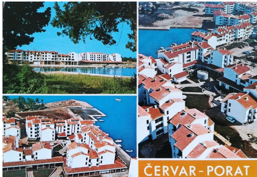
Slika 5: Červar Porat 1981. godine.

Postizanje najboljih turističkih brojki do tad rezultiralo je potrebom izrade novih razvojnih planova. Budući da su najbolje turističke rezultate u Hrvatskoj ostvarivale primorske regije, kreće se u izradu prostornog plana Gornji Jadran koji je obuhvaćao Istru i Kvarner. Provedena je SWOT analiza turističkog razvoja Istre kojom je utvrđeno da je Poreština vrlo atraktivna za provođenje inicijativa s ciljem još većeg razvitka turizma na tom području. 30 Zalaganje hotelskih poduzeća za proširenje ponude zabavnih i sportskih sadržaja ispostavilo se kao uspješan potez za povećanje broja gostiju i broja noćenja. Plava laguna je 1970. u svojim objektima zabilježila 1.281.500 noćenja. 31 Također, te godine najviša turistička potrošnja ostvarena je u čvrstim objektima poduzeća.