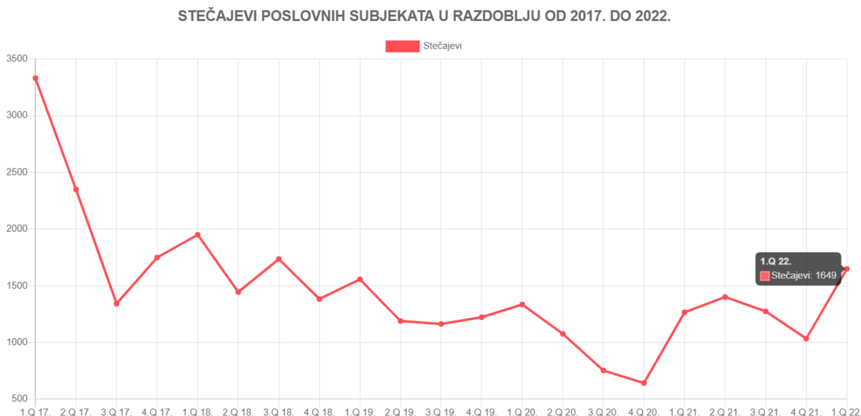
Grafikon 1. Stečajevi poslovnih subjekata od 2017. do 2022. godine