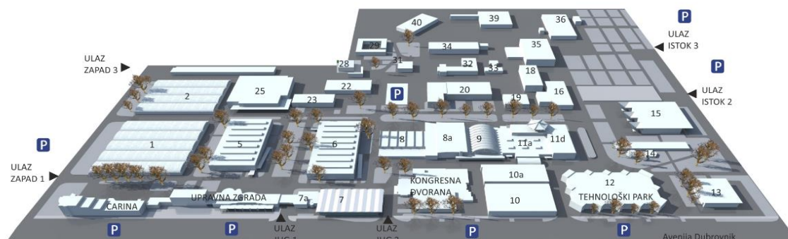
Slika 1. Maketa Zagrebačkog Velesajma

Sajmovi su mjesta inovacija i razlika, mjesta društvenosti, spoznaje vlastitih kvaliteta i mogućnosti. 177 Izgradnja Zagrebačkoga velesajma bila je bitna ponajprije zbog gospodarske veze Jugoslavije sa zemljama istočnog bloka iza željezne zavjese i sa zemljama srednje i zapadne Europe. Velesajam je bio poveznica između zemalja koje politički nisu bile u najboljim odnosima, a upravo je zato projekt izgradnje bio sveobuhvatan. 178 Zagrebački velesajam s bogatom poviješću zauzima značajno mjesto u gospodarskome životu Zagreba, pružajući prostor za susret sa suvremenim tehnološkim inovacijama i novitetima. 179 Božidar Rašica bio je zadužen za projektiranje pojedinačnih paviljona velesajma (paviljon Austrije iz 1958., paviljon Autosalon 1961., paviljon Ujedinjene Arapske Republike, SSSR-a, Italije i Brazila iz 1965., paviljon drvne industrije iz 1970., kemijski paviljon 1971., te i za paviljon Exportdrva iz 1972. godine). Paviljon Demokratske Republike Njemačke iz 1964. ozbiljna je, zatvorena staklena neprozirna zgrada s čvrstom konstrukcijom od armiranoga betona. 180 Osim paviljona 1964. Rašica radi i eksperimentalni objekt „ljuska“ koji predstavlja nadstrešnicu u obliku hiperboloida. 181