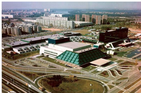
Slika 6. Sava centar