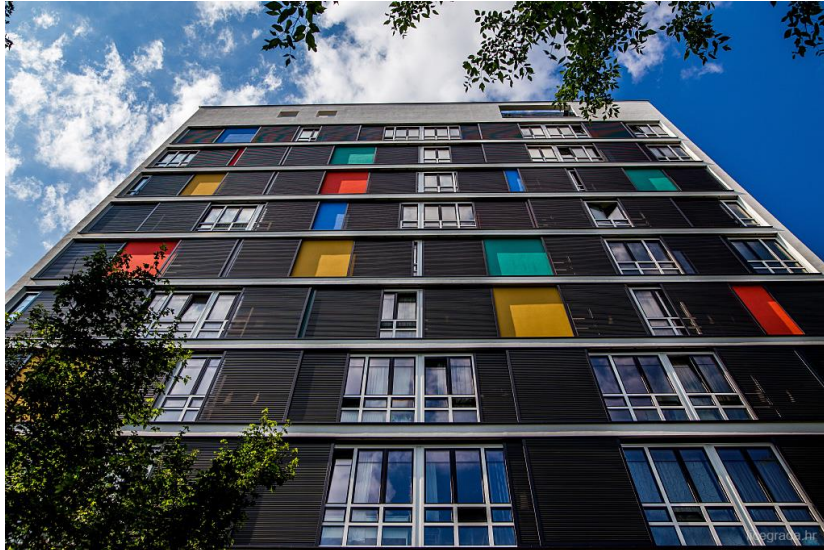
Slika 3. Vitićev neboder