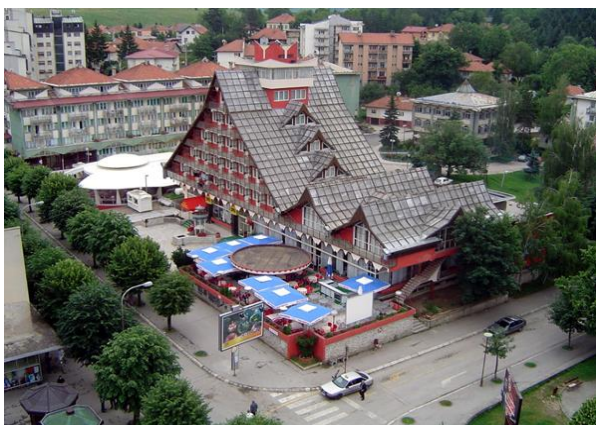
Slika 2. Hotel Pljevlja 2004.