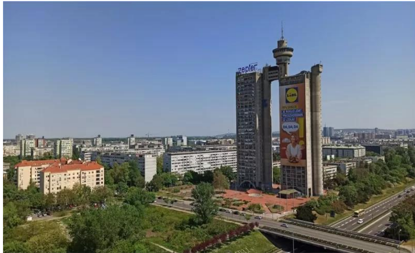
Slika 7. Geneks kula