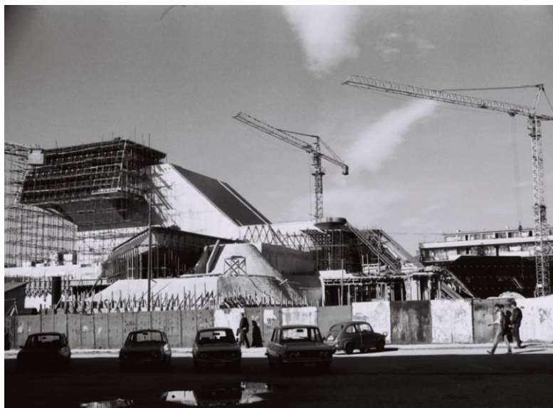
Slika 9. Dom revolucije u Nikšiću 1979.