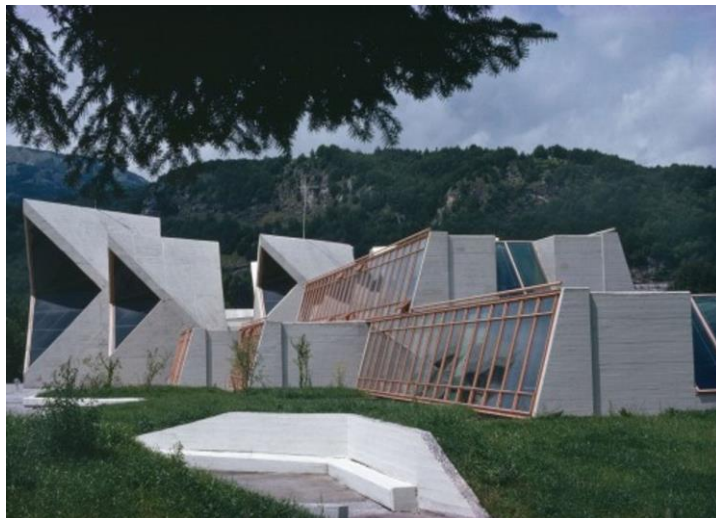
Slika 8. Spomen-dom u Kolašinu