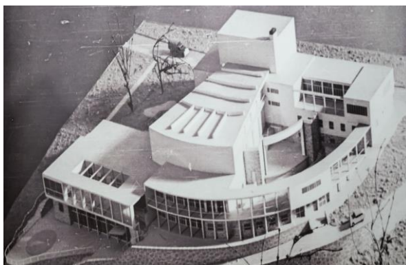
Slika 10. Maketa Društvenog doma u Konjicu