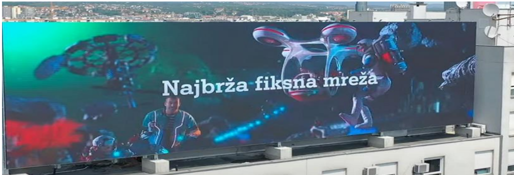
Slika 3. Primjer gigantskog elektroničkog panoa