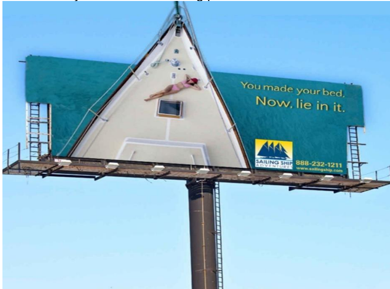
Slika 4. Primjer trodimenzionalnog plakata