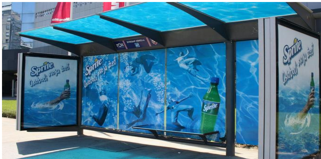
Slika 8. Primjer staklenog panela