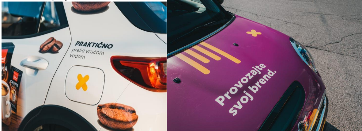
Slika 23. Kampanja Flaster vozila