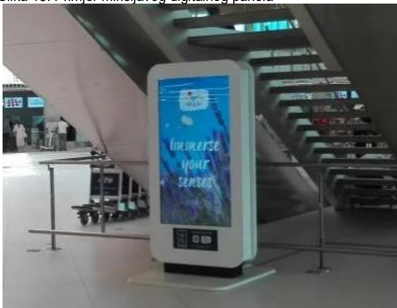
Slika 19. Primjer mirišljavog digitalnog panela