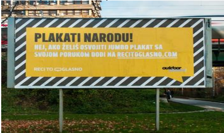
Slika 22. Primjer interaktivne kampanje