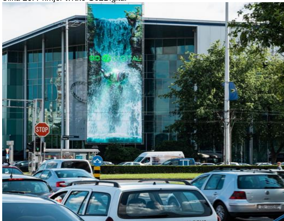
Slika 20. Primjer tvrtke Go2Digital