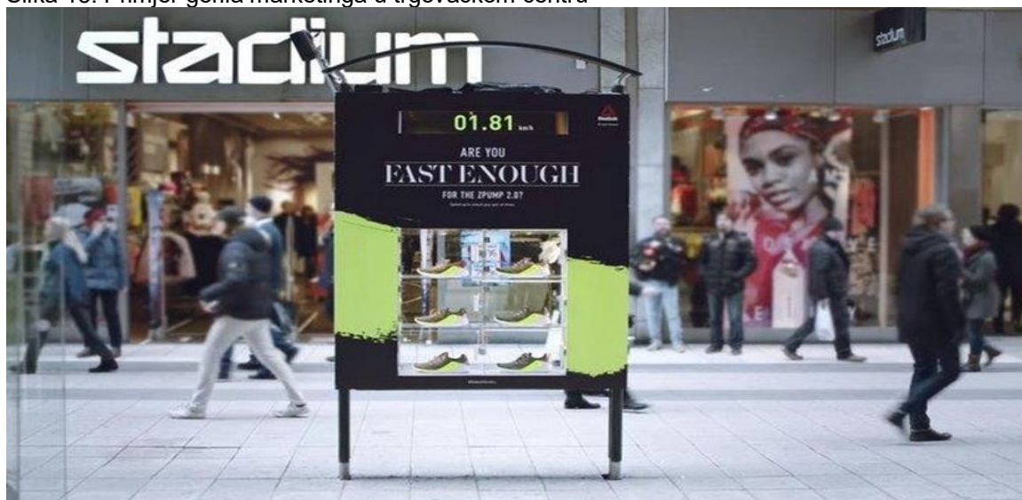
Slika 13. Primjer gerila marketinga u trgovačkom centru