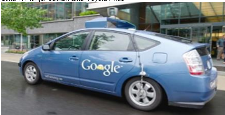
Slika 1. Primjer oslikan taxi Toyota Prius