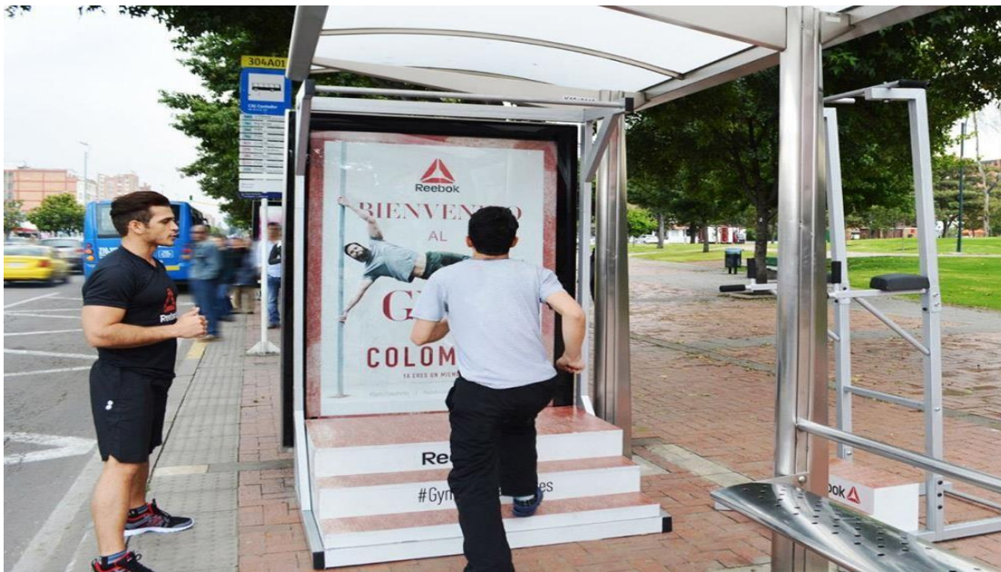
Slika 7. Primjer gerila marketinga na autobusnoj stanici