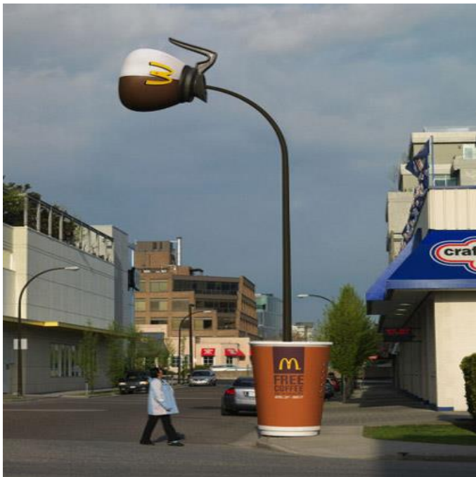
Slika 16. Primjer inovativnog vanjskog oglašavanja