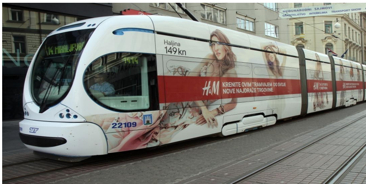
Slika 5. Primjer oslikanog tramvaja