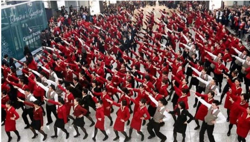
Slika 18. Primjer flash moba