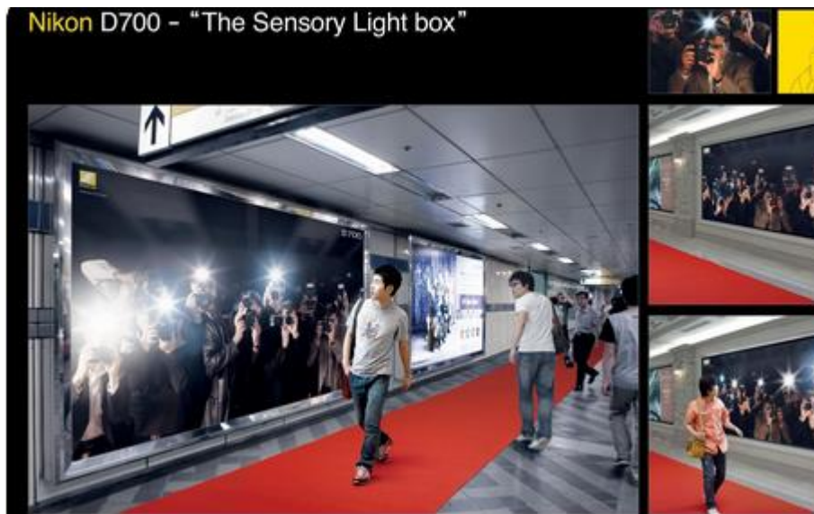
Slika 11. Primjer gerila marketing – Nikon kampanja