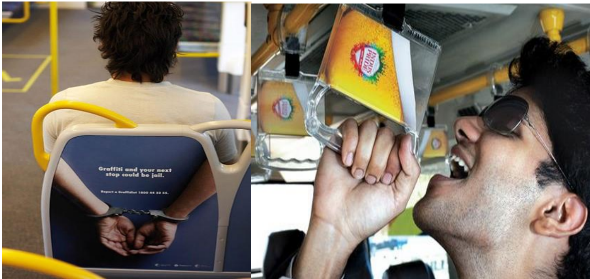
Slika 6. Primjer gerila marketinga