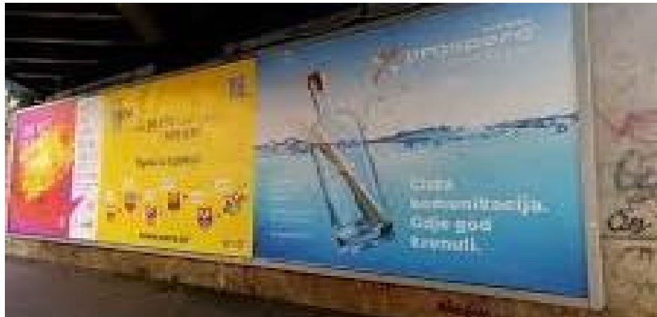
Slika 2. Primjer jambo panoa u Savskoj ulici