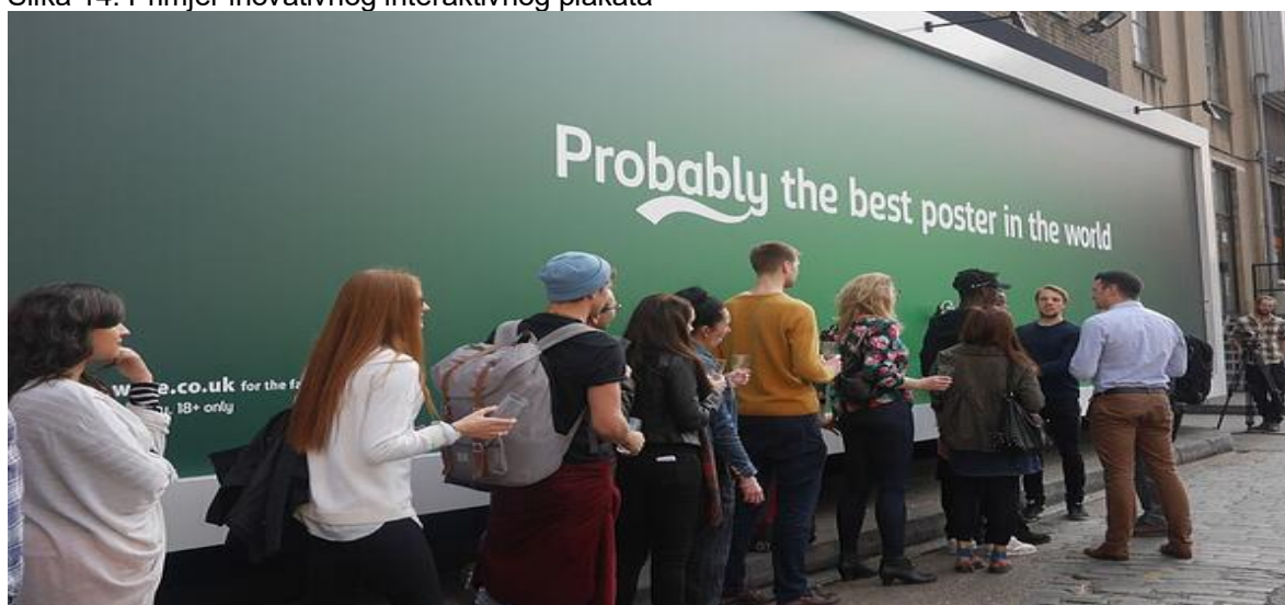
Slika 14. Primjer inovativnog interaktivnog plakata