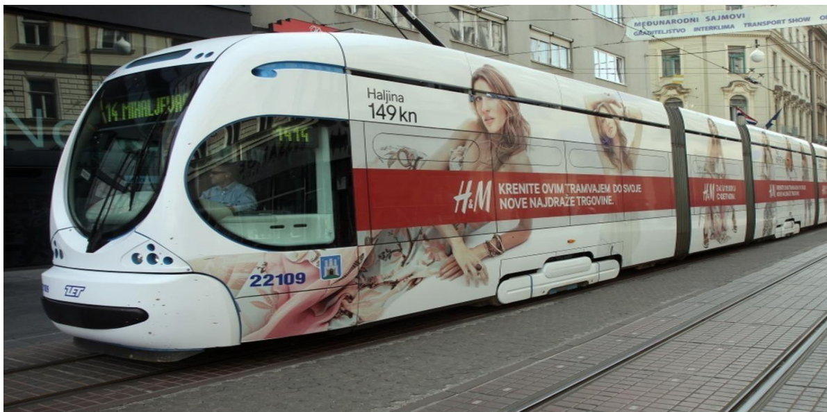
Slika 5. Primjer oslikanog tramvaja