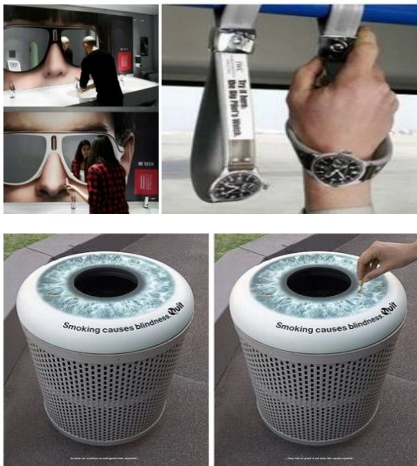
Slika 15. Primjer inovativnog oglašavanja