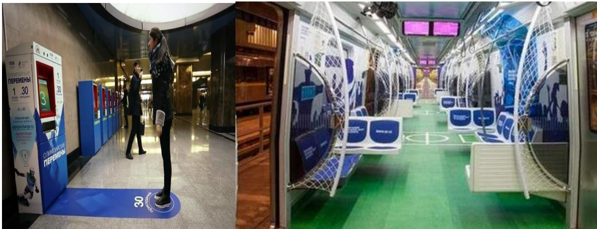
Slika 12. Primjer gerila marketinga u metrou