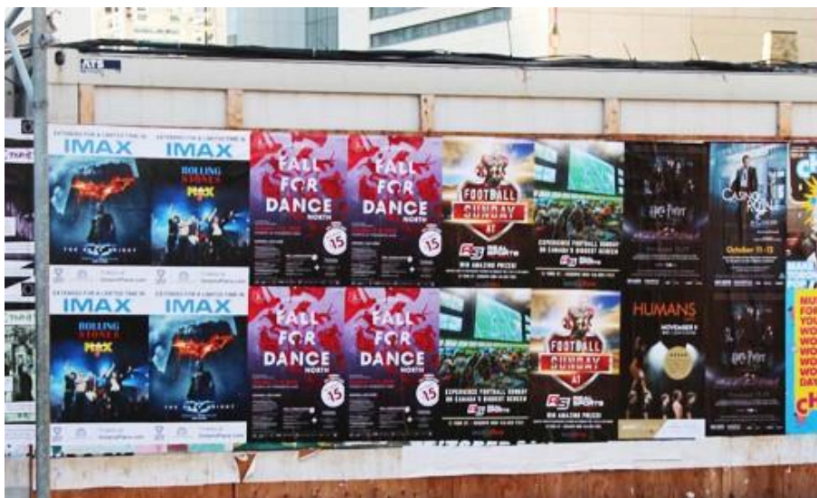
Slika 17. Primjer divljeg oglašavanja (engl.wild postinga)