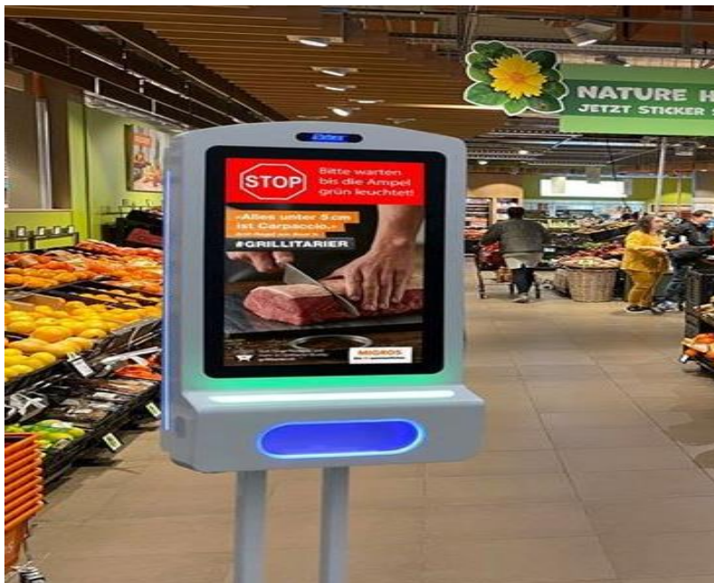
Slika 10. Primjer LCD ekrana sa mjeracem temperature