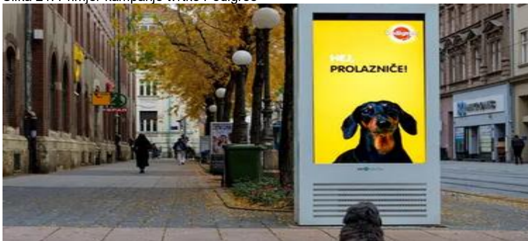
Slika 21. Primjer kampanje tvrtke Pedigree

2021. godine u sklopu međunarodne konferencije Interact podijeljene su nagrade za najuspješnije kampanje i projekte digitalnog oglašavanja na području Europe. Organizirala ju je IAB Europe tj. vodeće europsko strukovno udruženje za digitalno oglašavanje. U kategoriji Digitalnog vanjskog oglašavanja naši stručnjaci iz MediaComa i G02Digital osvojili su zlato. Radilo se o kampanji Pedigree Dentastix. Također su ponijeli i srebro u kategoriji Učinkovito korištenje podataka. To je obuhvaćalo projekt Dogvertising brenda Pedigree Dentastix.