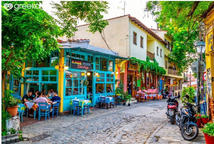
Slika 7. Ano Poli