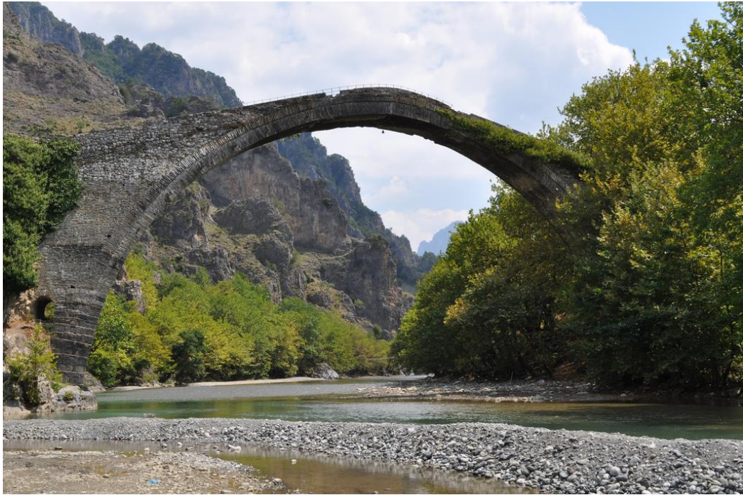
Slika 5. Nacionalni park Vikos-Aoos

također obuhvaća važno stanište za ptice grabljivice i mnoge druge vrste ptica. Park privlači posjetitelje radi prirodne ljepote i planinarenja. 32