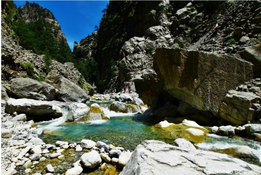
Slika 4. Nacionalni park Samaria

Klanac Samaria već 50 godina podliježe statusu zaštite Nacionalnog parka. Od svog proglašenja nacionalnim parkom 1962. godine. Danas je jedan od najvažnijih stupova održivog razvoja cijelog otoka Krete i iznimno je važan lokalnim zajednicama koje žive u blizini Nacionalnog parka. 30