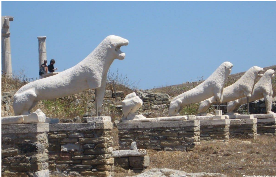
Slika 11. Arheološko nalazište Delos (izvor: https://www.mykonosbeachesguide.com/attractions/delos-island.html 17.6.2023.)

Osim turističkih atrakcija, Mikonos također nudi mogućnosti za istraživanje kulturne baštine. U blizini otoka nalazi se Delos (sl 6.) arheološko nalazište i jedno od najvažnijih antičkih svetišta u Grčkoj. U Delosu se nalaze brojni spomenici i antičke ruševine, uključujući hramove, amfiteatar i ostale arheološke ostatke.