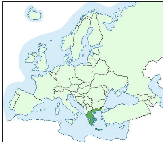
Slika 1. Geografski položaj Grčke (izvor: https://enciklopedija.hr/Natuknica.aspx?ID=23212 , 23.5.2023.)

Kopneni dio je ukupne površine od 131.960 kilometara kvadratnih što ju čini 10. najvećom zemljom u Europi. Obala se prostire na 13.676 km te ima prosječnu nadmorsku visinu od 498 metara. 1 Međutim, jedna od glavnih značajki geografskog položaja Grčke su njezine brojne otočne skupine. Grčka ima više od 2000 otoka, a 170 njih je nenaseljeno 2 , stvarajući jedinstvenu otočnu mrežu koja dodatno obogaćuje njezin geografski krajolik.