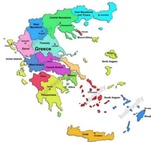
Slika 6. Karta regija Grčke

Grčka se može podijeliti na 5 turističkih regija, a one uključuju: sjevernu Grčku, središnju Grčku, Jonske otoke, Egejske otoke te Kretu 42 . U ovom poglavlju opisati će se karakteristike svake regije uključujući najbitnije turističke destinacije u tim regijama.