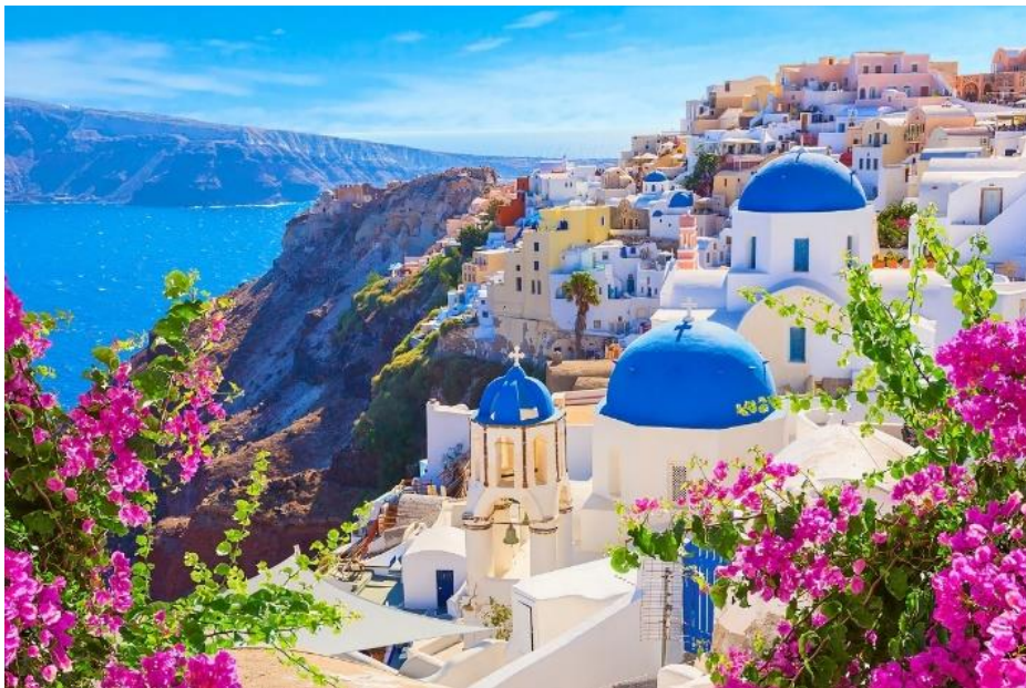
Slika 10. Santorini

Otok je također poznat po svojoj tradiciji i kulturi. Stari grad Oia s uskim uličicama, bijelim kućama i plavim kupolama pruža autentičan doživljaj tradicionalnog života na otoku. Posjetitelji mogu istražiti muzeje, galerije i radionice umjetnika, gdje će dobiti uvid u lokalnu umjetnost i zanate, uključujući slikarstvo, izradu nakita i keramiku.