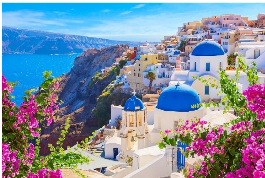
Slika 10. Santorini

Otok je također poznat po svojoj tradiciji i kulturi. Stari grad Oia s uskim uličicama, bijelim kućama i plavim kupolama pruža autentičan doživljaj tradicionalnog života na otoku. Posjetitelji mogu istražiti muzeje, galerije i radionice umjetnika, gdje će dobiti uvid u lokalnu umjetnost i zanate, uključujući slikarstvo, izradu nakita i keramiku.