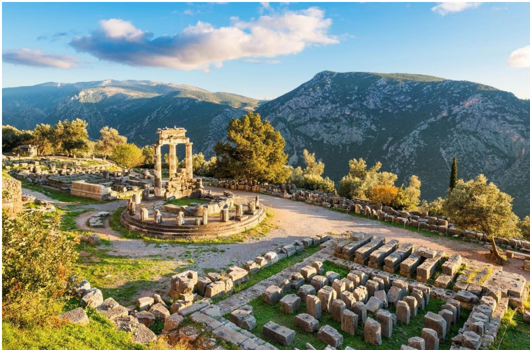
Slika 9. Apolonov hram u Delfiju

Posljedice turističke atrakcije Delfija su značajne. Svake godine tisuće turista dolaze da istraže mjesto i dožive njegovu kulturnu vrijednost. Turizam je postao ključni izvor prihoda za lokalnu zajednicu, potičući razvoj turističkih infrastruktura, kao što su hoteli, restorani i suvenirnice. Također se održavaju kulturni događaji i festivali kako bi se privukli posjetitelji tijekom cijele godine.