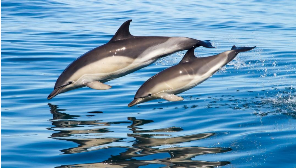
Slika 2. Obični dupin (izvor: https://www.dolphin-way.com/dolphins-the-facts/some-dolphin-species/common-dolphin-delphinus-delphis/ , 25.5.2023.)

Grčki otoci također imaju svoju specifičnu faunu. Na primjer, Kreta je dom za endemske vrste kao što je kretski divlji jarac ( Capra aegagrus cretica ), koji je postao simbol otočnog ekosustava. Ova vrsta jarca prilagođena je suhom i kamenitom okruženju otoka.