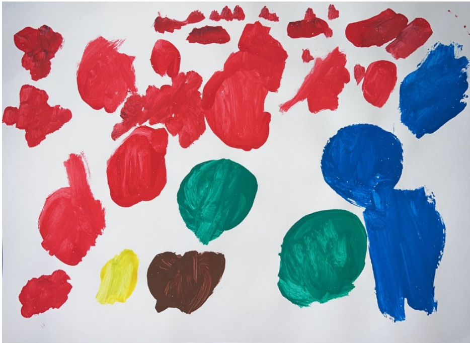
Slika 7: Sofia (3 godine i 8 mjeseci) "Točke"