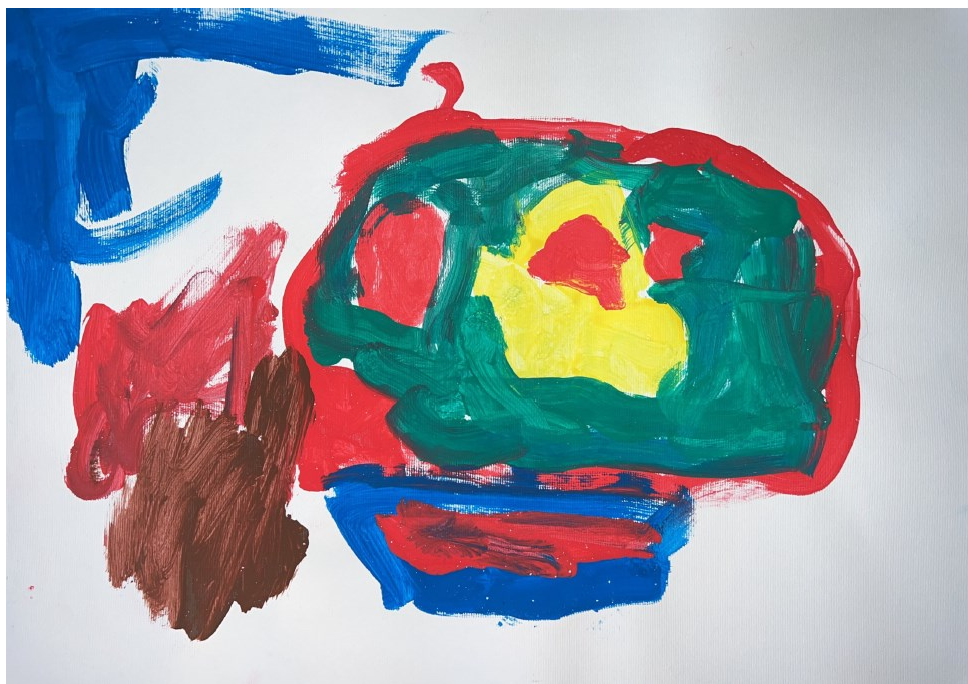
Slika 6: Kiara (5 godina i 5 mjeseci) "Auto"