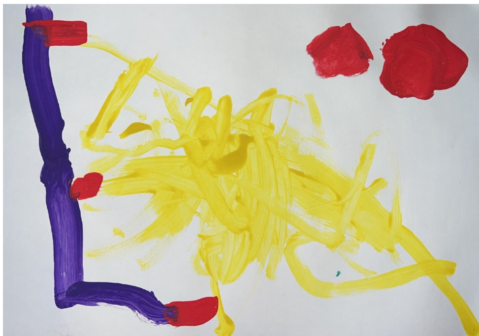
Slika 4: Fabian (4 godine i 10 mjeseci) "Stroj"