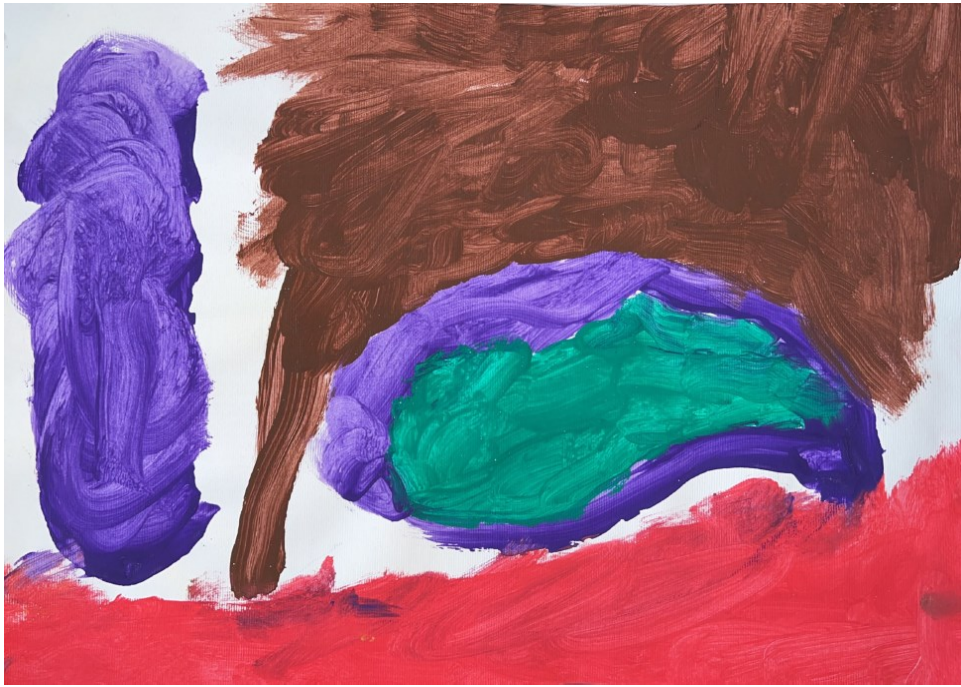
Slika 8: Aleks (4 godine i 10 mjeseci) "Borba"