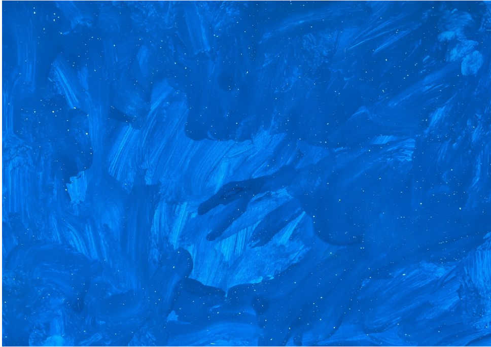
Slika 5: Vito (5 godina) "Skladatelj"