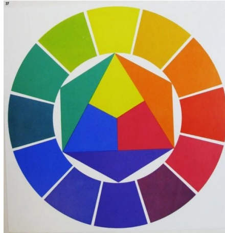
Slika 1. Krug čistih boja prema Ostwaldu