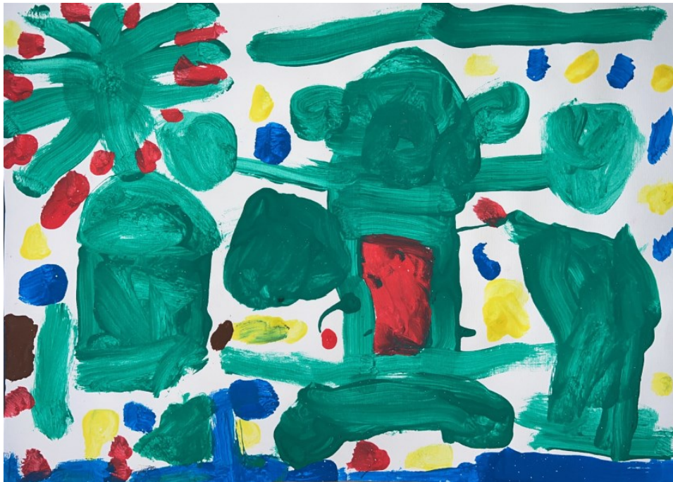
Slika 3: Rafael (4 godine i 11 mjeseci) "Ljudi koji idu u rat"