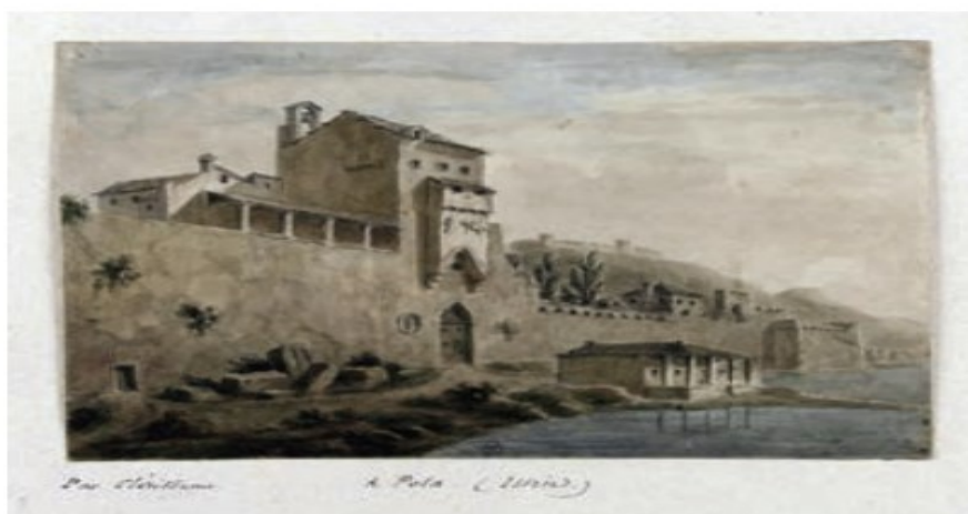
Slika 1. Gradski bedemi