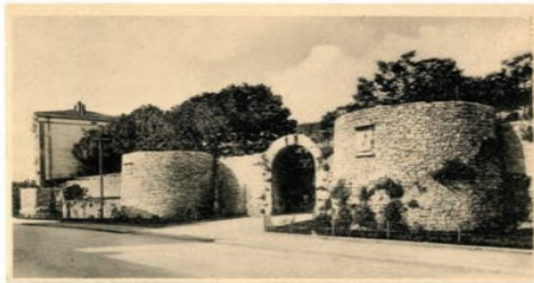
Slika 2. Pulski gradski bedemi, Herkulova vrata