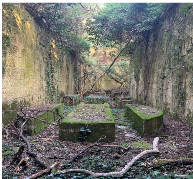
Slika 5. Prikaz devastiranosti utvrde Sv. Andrija (Kaiser Franz I) na Otoku Sv. Andrija.