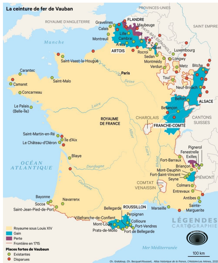
Slika 10. Prikaz sustava fortifikacija Vauban