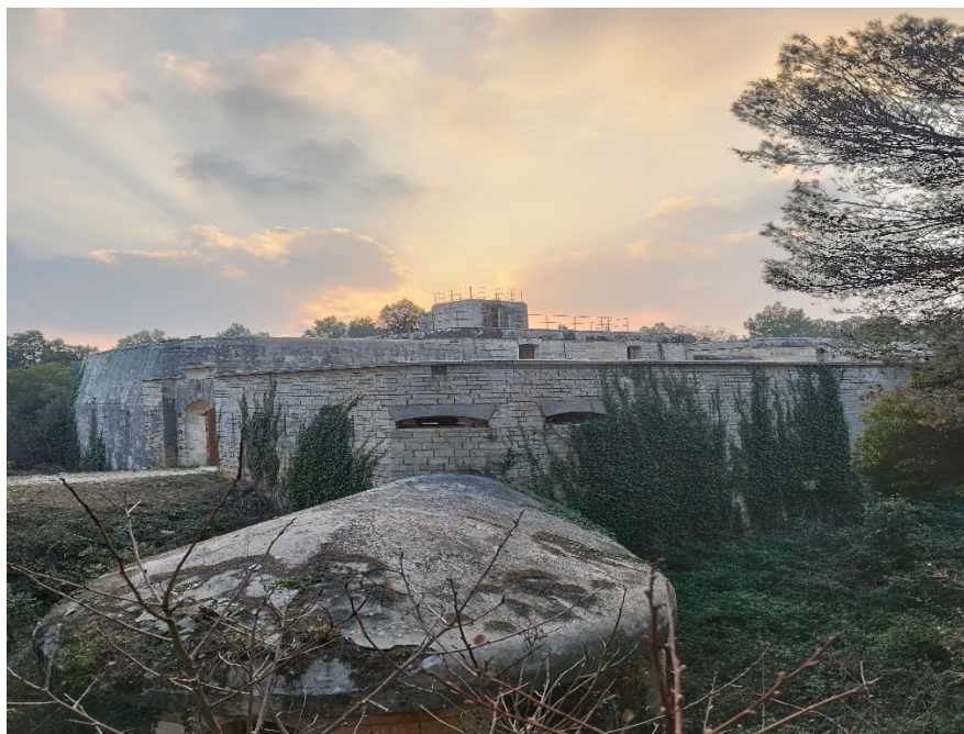
Slika 6. Obalna bitnica San Benedetto

Cjelokupni fortifikacijski sustav se neodgovorno rabi i podložan je postupnom propadanju. Većina objekata je napuštena i u većoj mjeri devastirana i opljačkana. Utvrde koje su dobile određenu namjenu uglavnom su pretvorene u skladišta neadekvatnom procjenom projektanata. Određene utvrde su srušene, a neke, iako se nalaze u blizini turističkih atraktivnih lokacija, u stanju propadanja (Krizmanić 2008, 181).