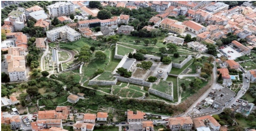
Slika 3. Kaštel Pula – Povijesni i pomorski muzej Istre