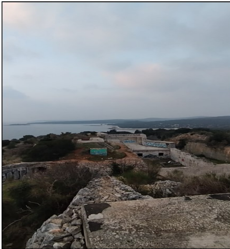
Slika 7. Utvrda Fort Forno