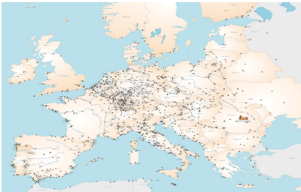
Slika 8. Utvrde i fortifikacijska baština na području Europe