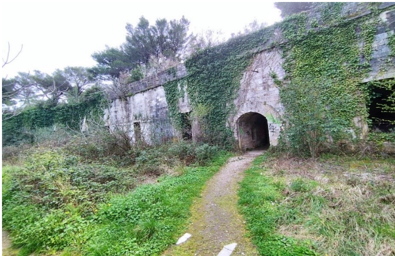
Slika 4. Bitnica Ovine prekrivena vegetacijom