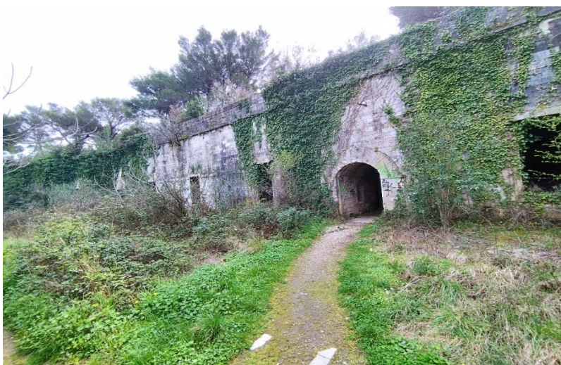
Slika 4. Bitnica Ovine prekrivena vegetacijom