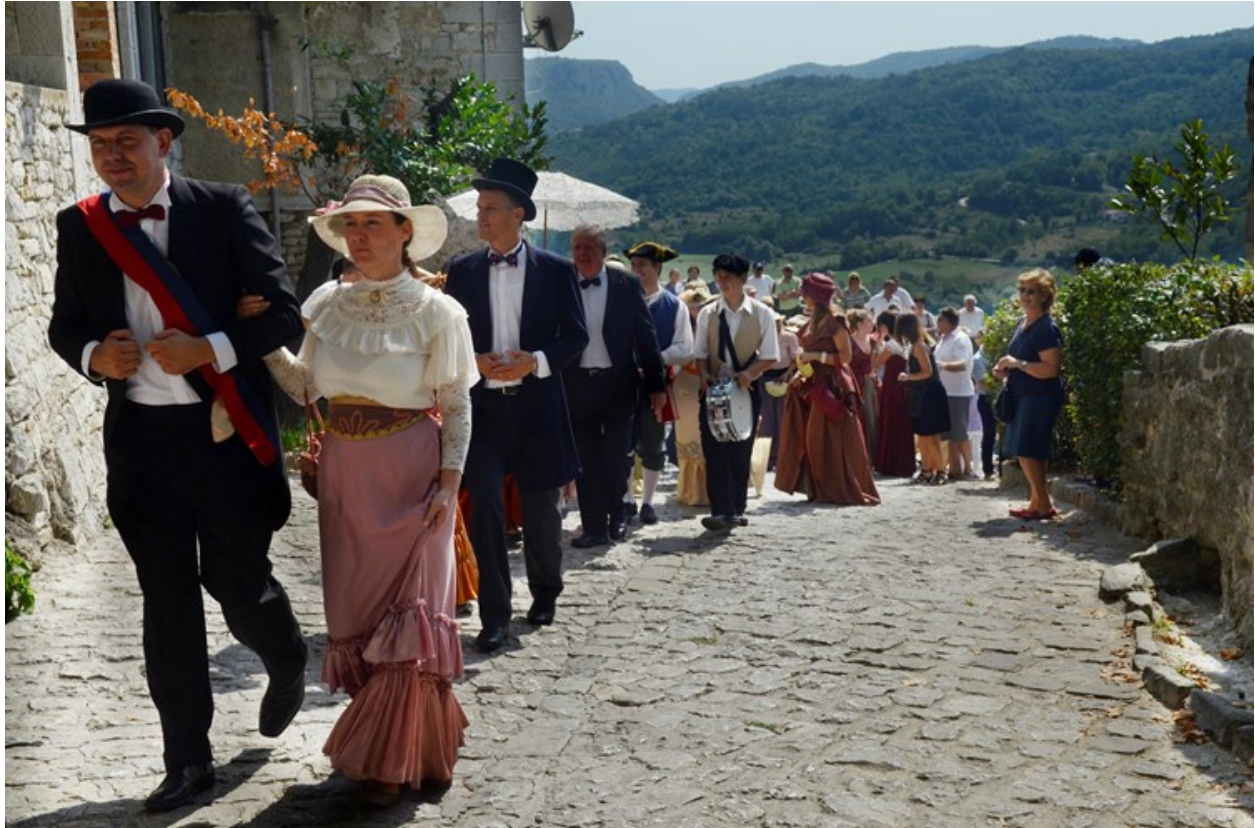
Slika 2. Mimohod na Subotini po starinski