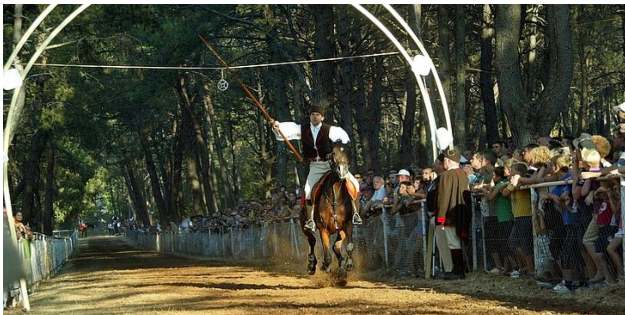
Slika 6. Trk na prstenac