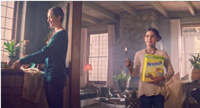
Slika 11. Nesquik

sve je veći broj muškaraca/očeva koji preuzimaju cjelodnevnu brigu za dijete, ali nisu zastupljeni u reklamnim sadržajima na jednak način.