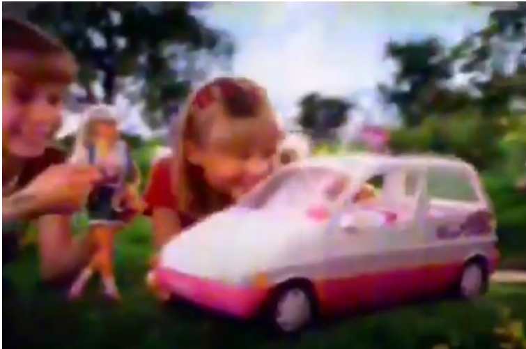
Slika 6. Barbikin minikombi 1995

Kada je došla na tržište, lutka Barbie bila je san svake djevojčice. Iako se smatra da više nismo podložni rodnim stereotipima u onoj mjeri u kojoj je to bilo nekada, i dalje je ciljana skupina za ovu vrstu proizvoda isključivo ženska.