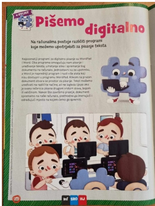
Slika 5. Dječaci i djevojčice za računalima

Kada se govori o računalnoj tehnologiji smatra se da u tom sektoru dominiraju dječaci. No, u navedenom primjeru se nalazi jednak broj dječaka i djevojčica koji sjede i rade za računalom. Iako se smatra da je korištenje računala za dječake, postoje djevojčice koje pokazuju jednaki interes za tom vještinom.