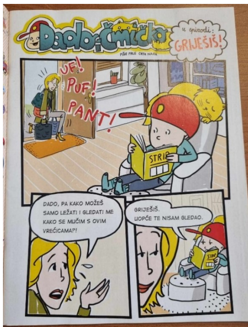
Slika 3. Nezainteresirani dječak

Na slici se prikazuje djevojčica koja u rukama drži bilježnicu s mnogo upitnika i upaljenom lampicom iznad glave. Smatra se da je ženski spol usmjereniji na obrazovanje od muškoga. Djevojčice se smatraju vrijednima i odgovornima, procjenjuje se da su sklonije verbalnom izražavanju od dječaka te da lakše verbaliziraju svoje misli i pretpostavke. U tom smislu procjenjuje ih se i znatizeljnijima.