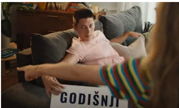
Slika 9. Jana Ice Tea

Reklama tematizira muško-ženske odnose na primjeru dvoje tinejđera. Brat nije odradio poslove za koje je preuzeo odgovornost i ignorira sestru koja ga na to upozorava objavljivanjem natpisa „GODIŠNJI“. Ova reklama humor pokušava graditi na stereotipu u kojem djevojčice tradicionalno odrađuju sve svoje (pa i kućanske) zadatke, do su ih dječaci skloni ignorirati i na taj način prepustiti da djevojke/žene odrade i njihove obaveze. To ide u prilog prije navedenom tradicionalnom stavu da muški član obitelji, nakon odrađenog posla izvan kuće, ne bi trebao biti opterećivan s kućanskom poslovima.