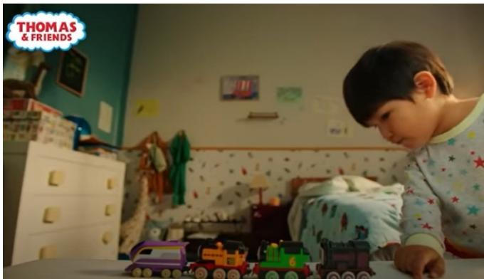
Slika 8. Tomica i prijatelji, Izvor: https://www.youtube.com/watch?v=40jBeBiz760

Odabrana je još jedna reklama koja prikazuje proizvode koji su povezani s lutkom Barbie. Ormar s odjećom i dodacima ponovno je usmjeren na djevojčicu, bez prisustva dječaka. Djevojčica se igra u svojoj sobi u kojoj prevladavaju nježni tonovi ne samo ružičaste boje, ali cjelokupno uređenje sugerira romantičan, djevojački stil.