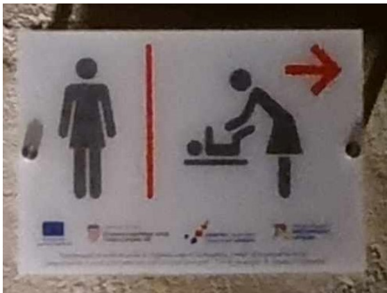
Slika 4. Oznaka za ženski javni toalet, Mletačka utvrda (Kaštel) Pula

Na slici možemo primijetiti dječaka koji je nemaran i nezainteresiran da pomogne svojoj majci s vrećicama iz trgovine. Dječak sjedi na fotelji i čita strip te bi volio da ga nitko ne ometa. Tradicionalno se smatralo da su kućanske obaveze primjerenije ženama i da muškarci nisu pozvani u njima sudjelovati. Dječak je u ovom stripu postavljen u klasičnu tradicionalnu „mušku“ pozu u kojoj muški član obitelji, nakon obavljenog posla izvan kuće, ima pravo odmarati i uopće se ne zamarati zbivanjima oko sebe. Iako humor u ovom stripu proizlazi iz odgovora da dječak uopće nije vidio svoju majku koja nosi teške vrećice (pri čemu majka ima osmijeh na licu iz čega se može zaključiti da joj je to zabavno), činjenica da je dječak taj koji majku „nije vidio“ upućuje na povezanost sa stereotipima koji asociraju na stereotipne muško-ženske odnose.