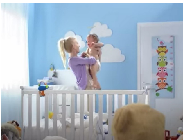
Slika 10. Violeta Double Care Pelene, Izvor: https://www.youtube.com/watch?v=VZ1stTGH-SI

Ovdje možemo primijetiti kako je majka u djetetovoj sobi i podigla je dijete u „najmekši“ zagrljaj. Smatra se da su majke te koje vode brigu o djetetu i imaju poseban dodir. Tradicionalno se naglašava povezanost majke i djeteta utoliko što je ona biće koje nakon rođenja, zahvaljujući svojoj fizionomiji, zadovoljava sve dječje potrebe, međutim