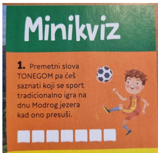
Slika 1. Dječak igra nogomet, Izvor: dječji časopis Smib, broj 6, veljača 2020.

Na slici se prikazuje dječak koji igra nogomet. Možemo primijetiti da se nogomet dodjeljuje dječacima te da se smatra iznimno muškim sportom koji nije primjeren za djevojčice, iako postoji i kao sportska disciplina za njih. Postoji čitav niz sportova koji se smatra primjeren ženama, a vrlo je često povezan s elegancijom u pokretima poput plesa i ritmike.