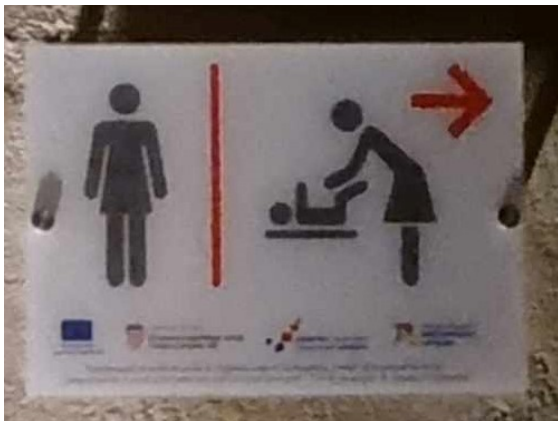
Slika 4. Oznaka za ženski javni toalet, Mletačka utvrda (Kaštel) Pula

Na slici možemo primijetiti dječaka koji je nemaran i nezainteresiran da pomogne svojoj majci s vrećicama iz trgovine. Dječak sjedi na fotelji i čita strip te bi volio da ga nitko ne ometa. Tradicionalno se smatralo da su kućanske obaveze primjerenije ženama i da muškarci nisu pozvani u njima sudjelovati. Dječak je u ovom stripu postavljen u klasičnu tradicionalnu „mušku“ pozu u kojoj muški član obitelji, nakon obavljenog posla izvan kuće, ima pravo odmarati i uopće se ne zamarati zbivanjima oko sebe. Iako humor u ovom stripu proizlazi iz odgovora da dječak uopće nije vidio svoju majku koja nosi teške vrećice (pri čemu majka ima osmijeh na licu iz čega se može zaključiti da joj je to zabavno), činjenica da je dječak taj koji majku „nije vidio“ upućuje na povezanost sa stereotipima koji asociraju na stereotipne muško-ženske odnose.