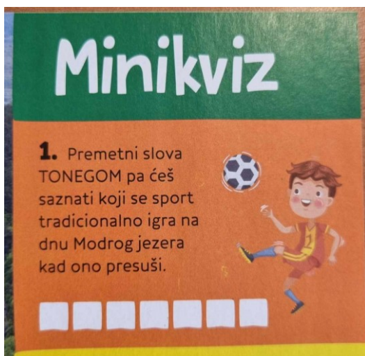
Slika 1. Dječak igra nogomet, Izvor: dječji časopis Smib, broj 6, veljača 2020.

Na slici se prikazuje dječak koji igra nogomet. Možemo primijetiti da se nogomet dodjeljuje dječacima te da se smatra iznimno muškim sportom koji nije primjeren za djevojčice, iako postoji i kao sportska disciplina za njih. Postoji čitav niz sportova koji se smatra primjeren ženama, a vrlo je često povezan s elegancijom u pokretima poput plesa i ritmike.