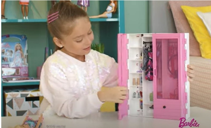
Slika 7. Barbie ormar s lutkom, Izvor: https://www.youtube.com/watch?v=Ob3DBM_k-C4

najsličniju ljudima koji žive u nordijskim zemljama (plave kose i bijele puti), što se može prepoznati kao rasni stereotip, kao usmjerenost na potrošače bijele rase ili na sugeriranje idealnog izgleda koji se danas propagira i na mnoge druge načine.