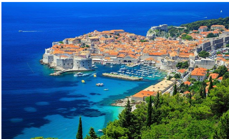
Slika 6. Dubrovnik

Hrvatska je zemlja male veličine, ali velika po broju UNESCO-vih zaštićenih područja. Postoji ukupno 10 mjesta svjetske baštine UNESCO-a, a mnoga od njih su svjetski popularna mjesta poput Dioklecijanove palače u Splitu ili gradskih zidina Dubrovnika. Dubrovnik je najposjećeniji i najpoznatiji grad hrvatskog Mediterana. Nalazi se na UNESCO-vom popisu svjetske baštine i jedan je od najviše fotografirani gradova u Hrvatskoj. Sa svojom idealnom lokacijom (u južnoj Hrvatskoj) s pogledom na čisti plavi Jadran, s netaknutim plažama, ležernim bistroima koji poslužuju vrhunske morske plodove, Dubrovnik čini jednim od jedinstvenih gradova okruženih zidinama koje vrijedi posjetiti u Hrvatskoj.