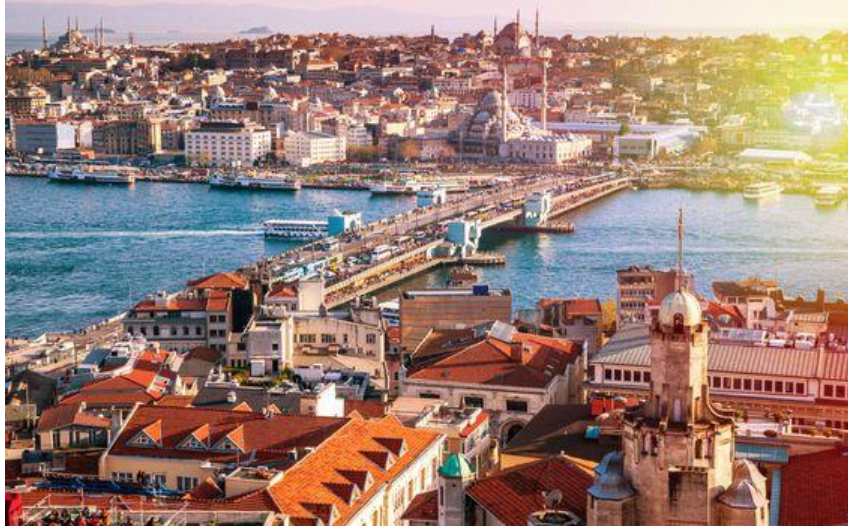
Slika 3. Istanbul