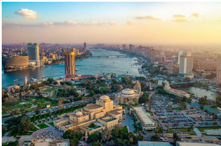
Slika 5. Kairo

Najpoznatije i najposjećenije turističke destinacije afričkog dijela Mediterana su Egipat i Tunis. Egipat je zemlja sa vrlo dugačkom turističkom tradicijom. Već u 19. stoljeću su se u ovoj zemlji organizirala prva krstarenja Nilom za bogate kraljevske obitelji Europe. U posljednjih nekoliko desetljeća Egipat radi na privlačenju turista iz arapskih zemalja, što se događa iz političkih razloga. Pustinje zauzimaju 95% zemlje, što je idealno za razvoj turizma temeljenog na prirodi. Najposjećeniji grad je Kairo, koji je i glavni grad.