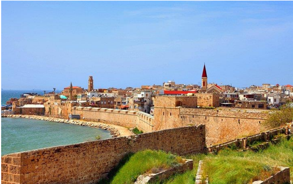
Slika 4. Akre

Jerihonu. Od prirodnih atrakcija najveću posjećenost ima Mrtvo more. 11 Uz vjerski turizam, nudi i sunce, more, ronjenje u Crvenom moru, liječenje u Mrtvom moru s ljekovitim blatom, a ima i jako bogatu gastronomsku ponudu.