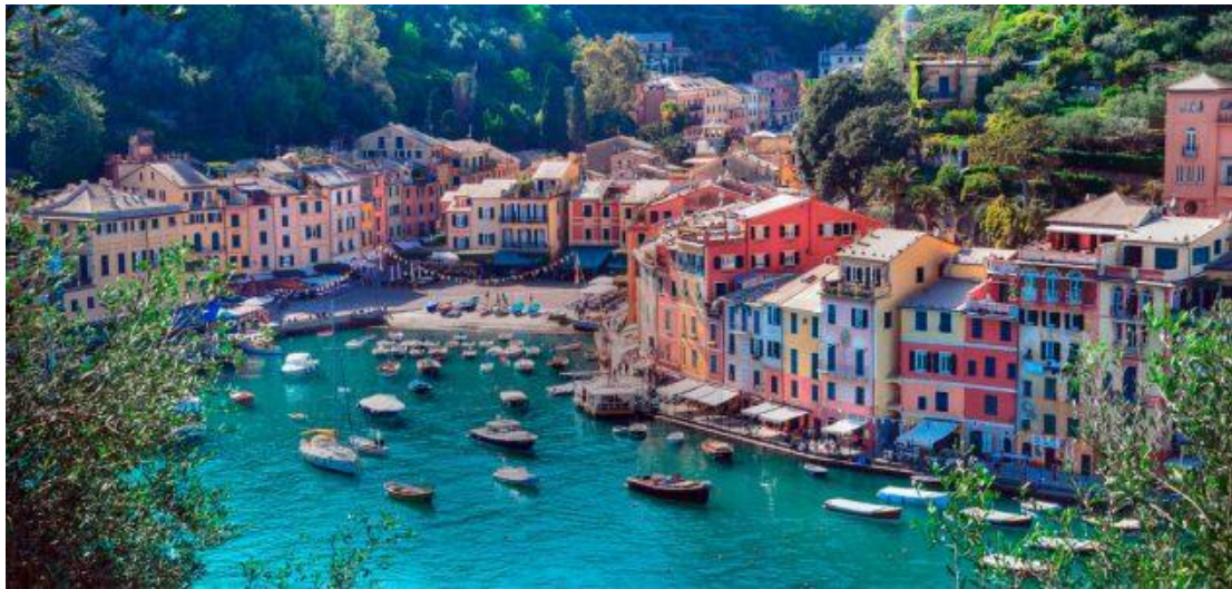
Slika 8. Portofino

Portofino malo turističko mjesto smješteno pored Genove, nekad poznato po ribarima, danas poznat po luksuzu. Danas taj gradić privlači turiste željne glamura. Portofino obiluje brojnim znamenitostima od kojih možemo izdvojiti dvorac Castello Brown koji je pretvoren u muzej. Također treba izdvojiti i crkvu San Giorgio iz 12. stoljeća u kojoj se čuvaju relikvije zaštitnika grada.