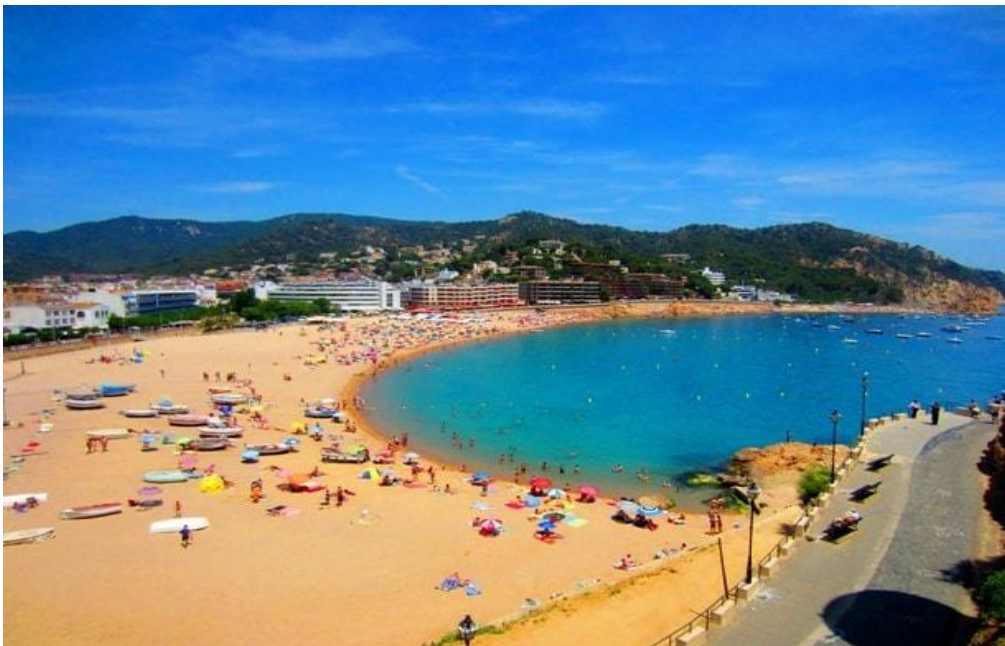
Slika 7. Lloret de Mar

Španjolska je podijeljena na pet velikih turističkih regija: Sredozemno primorje, Baleari, Kanari, Atlantsko primorje i unutrašnjost. Jedno od najpoznatijih središta je Lloret de Mar zbog svoje bogate kulturne povijesti, ali i kao destinacija za turizam sunca i mora. Lloret de Mar, grad na Costa Bravi u španjolskoj regiji Kataloniji, poznat je po svojim mediteranskim plažama. Srednjovjekovni dvorac Sant Joan na brežuljku, na istoku, pruža pogled na područje, dok središnja crkva Iglesia de Sant Romà pruža primjere katalonske gotike i modernističke arhitekture. Na litici s pogledom na more izgrađeni su vrtovi Santa Clotilde u stilu talijanske renesanse.