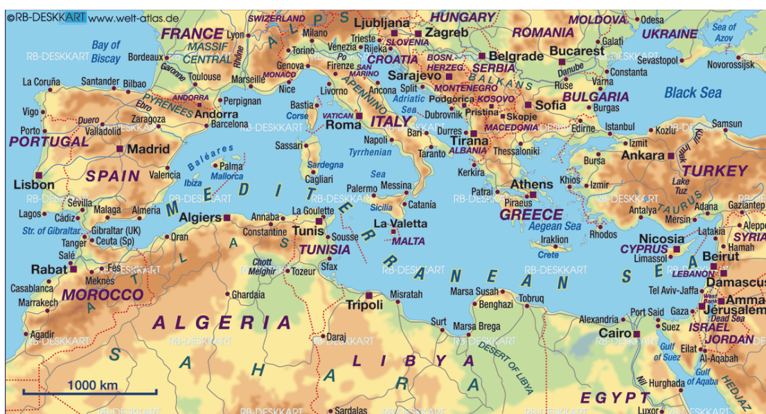
Slika 2. Mediteran

U ovom poglavlju daljnje je objašnjen mediteranski turizam te njegova osnovna obilježja prema kontinentima preko kojih se rasprostranjuje (Slika 2.).