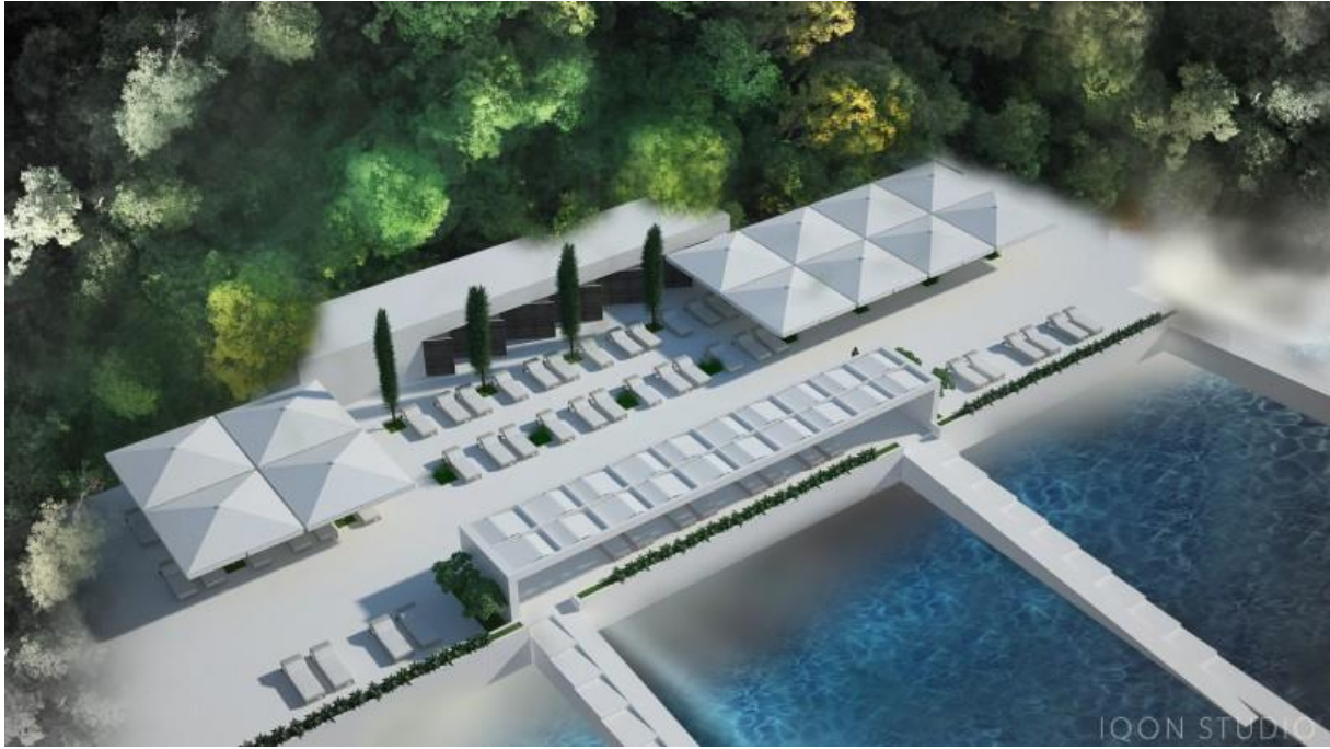
Slika 4. Vizualizacija plaža i partera sunčališta- KlinikeEnoch.