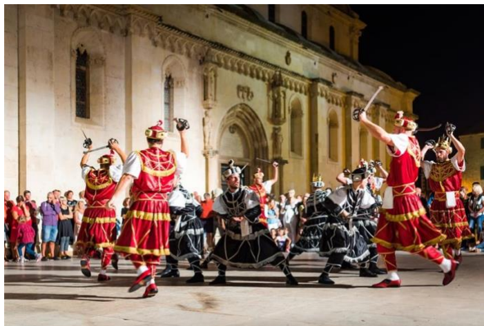
Slika 4. Srednjovjekovni sajam

Srednjovjekovni sajam – održava se za vrijeme proslave šibenskog zaštitnika sv. Mihovila u rujnu. Tijekom sajma, cijeli grad i ulice poprimaju štih srednjeg vijeka, a posjetitelji mogu uživati u raznim sadržajima poput viteških borbi, plesa, večernjim pomorskim bitkama, ponudi sajma, paljbi iz topova, jahanju konja itd.