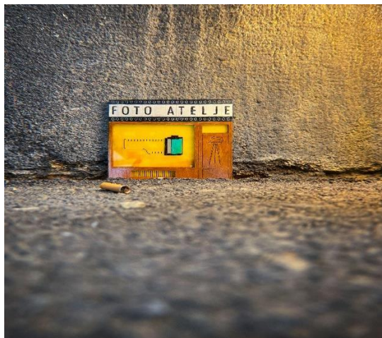
Slika 12. Jedan od primjeraka izložbe Mali Zagreb