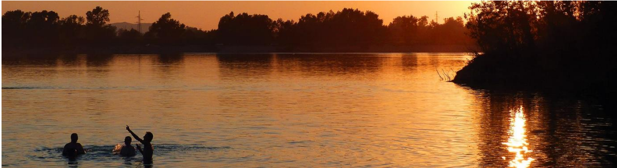
Slika 2. Jezero Zajarki u Zagrebu