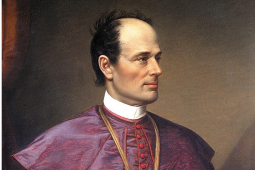
Slika 3. Biskup za vrijeme svojeg biskupstva