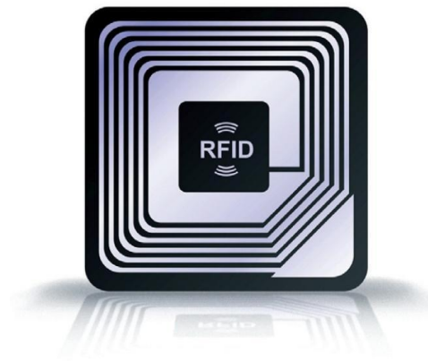
Slika 3 - Polu-pasivna RFID oznaka