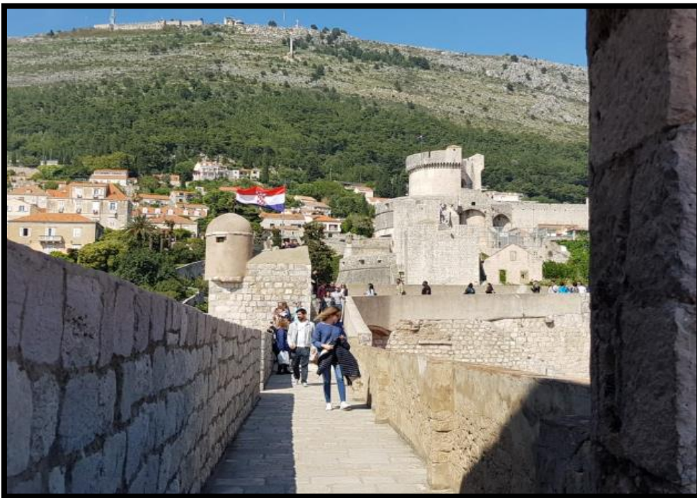
Slika 5: Dubrovačke gradske zidine