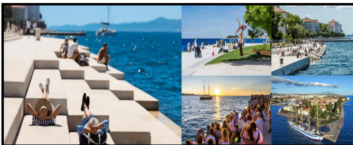
Slika 3.: Morske orgulje, Zadar