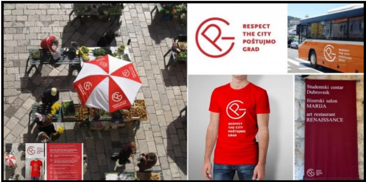
Slika 4.: Logo inicijative „Respect The City“ na vidljivim mjestima gradske jezgre Dubrovnika