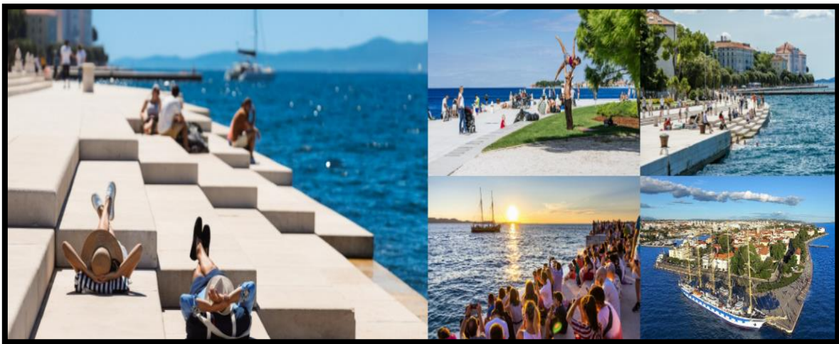
Slika 3.: Morske orgulje, Zadar