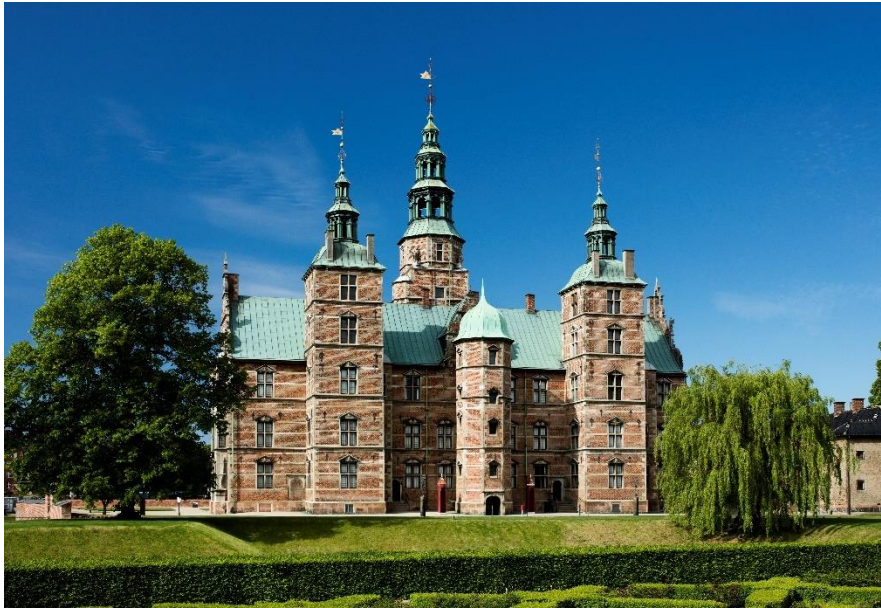
Slika 11. Dvorac Rosenborg