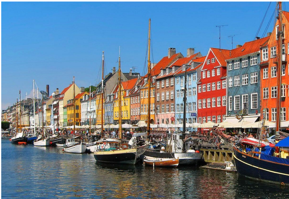
Slika 20. Nyhavn

preuređena u turističke, zabavne i baštinske svrhe, uključujući i kuće. Područje bivših brodskih pristaništa postalo je sve važnije s obzirom na baštinski turizam, dok je operna kuća u Kopenhagenu na otoku Holmen također dio obnove pristaništa (Lew i dr., 2008). Kopenhagen je posebno poznat po bujnom noćnom životu i toleranciji na različite stilove života (Boniface i dr., 2012). Jedna od kulturnih turističkih atrakcija Kopenhagena je Nyhavn (sl. 21), izvorno prometna trgovačka luka u koju bi pristajali brodovi iz cijelog svijeta. Područje je bilo prepuno mornara, pubova i pivnica. Danas su stare kuće obnovljene, a restorani dominiraju starom lukom (Visit Copenhagen, 2023).