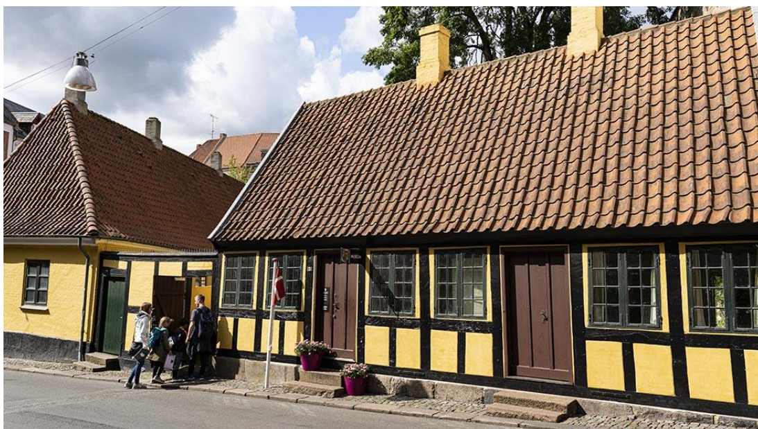
Slika 17. Rodna kuća Hans Christiana Andersena