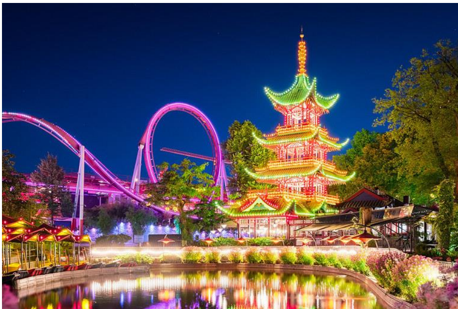
Slika 14. Tivoli Gardens

Zabavni park i vrt Tivoli Gardens otvoren je 1843. godine. Tivoli je bila jedna od inspiracija za Disneyland. Ima jedan od najstarijih drvenih vlakova smrti na svijetu, kao i najviši vrtuljak na svijetu. Iako je otvoren tijekom cijele godine, najveći broj ljudi dolazi u ljetnim mjesecima kada se također održavaju koncerti i drugi događaji (Lew i dr., 2008). Kad je osnovan, bio je postavljen izvan grada, ali danas se nalazi odmah do Glavnog kolodvora i na pješačkoj udaljenosti od gradske vijećnice. Tivoli ima egzotičnu arhitekturu, povijesne zgrade i bujne vrtove. Tivoli je poznat su po povijesnom šarmu i atmosferi i smatraju se kulturnom ikonom Kopenhagena (Visit Denmark, 2023).