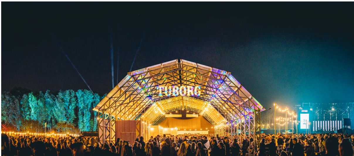
Slika 19. Northside

NorthSide (sl. 20) je trodnevni glazbeni festival koji se svake godine održava u lipnju u Aarhusu. Ima četiri pozornice s rotirajućim umjetnicima i nekoliko sporednih događaja i događaja. Prvi festival započeo je 2010. godine, a od 2011. godine festival se održava u Ådalenu. Na festivalu 2017. svakodnevno je sudjelovalo 40.000 ljudi. 2022. godine, po prvi put, NorthSide se održao u prirodi. Osim glazbenog profila i cilja stvaranja profita za svoje vlasnike, NorthSide ima izjavu o misiji usmjerenu na inovacije, održivost i uključenost kupaca. NorthSide je najodrživiji danski festival i posvećen je stalnom podizanju ljestvice novim, održivim inicijativama. Među brojnim inicijativama može se spomenuti da je sva hrana biljna i 100% organska, te da nema flaširane vode. Osim toga, 2022. godine NorthSide je bio prvi veliki festival na svijetu koji je radio na 100% zelenoj električnoj energiji (Visit Aarhus, 2023).