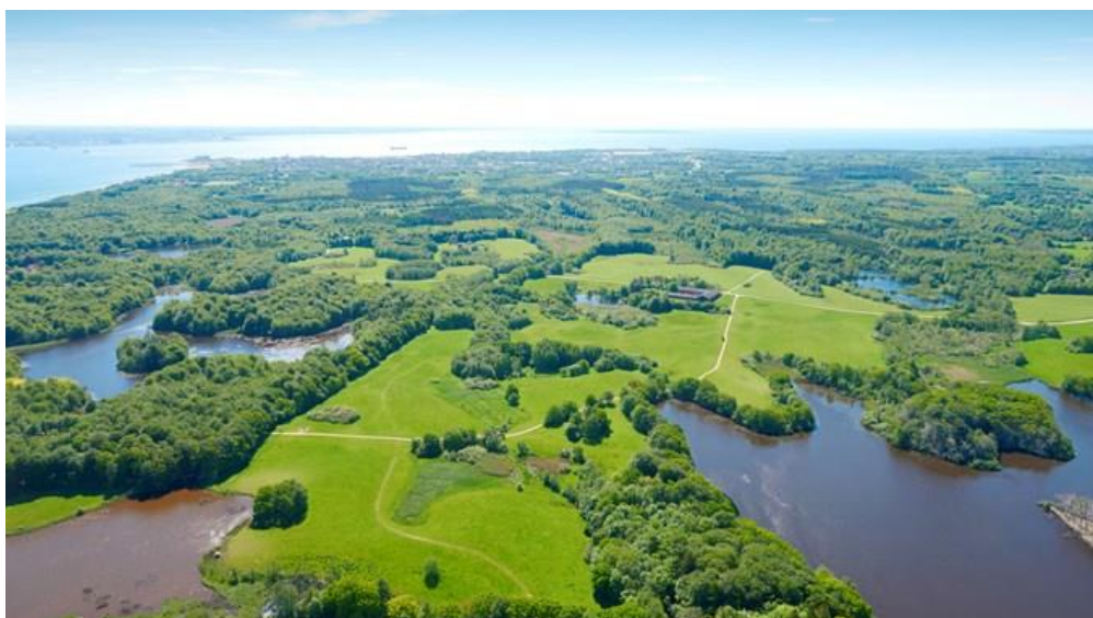
Slika 6. Nacionalni park Kongernes Nordsjaelland