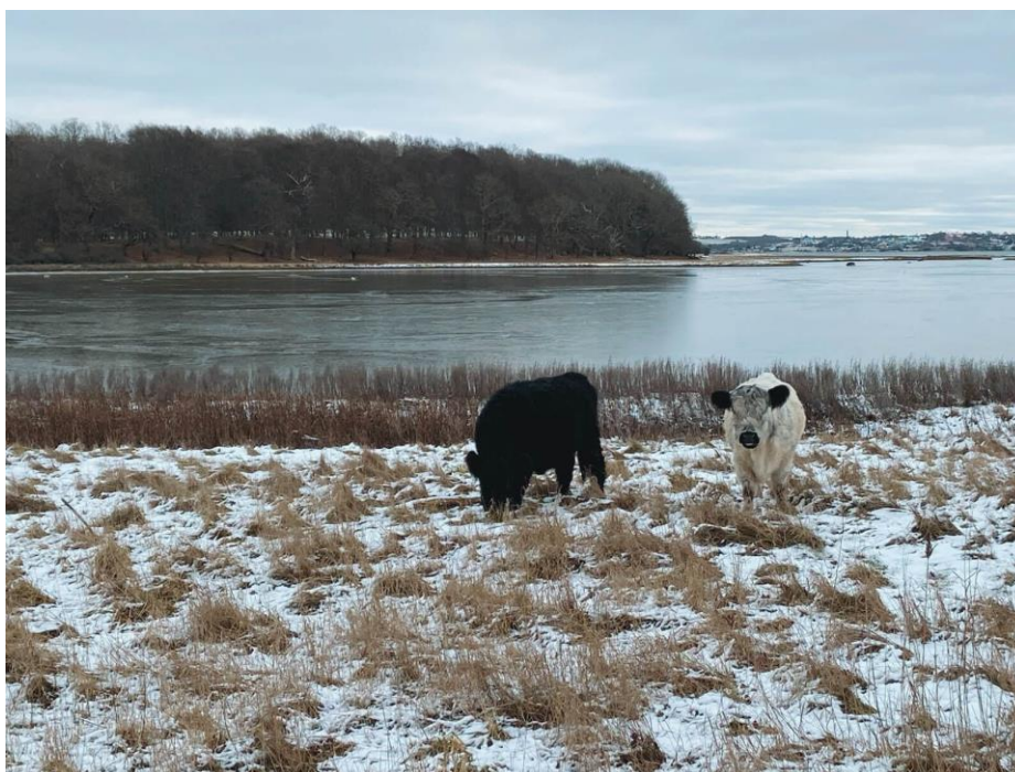
Slika 5. Nacionalni park Skjoldungernes Land