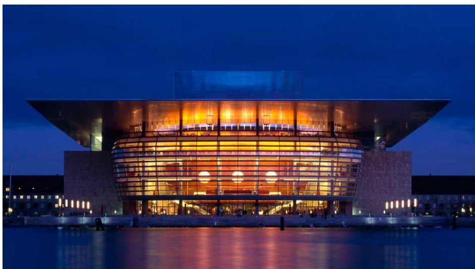
Slika 12. Kraljevsko kazalište – Opera