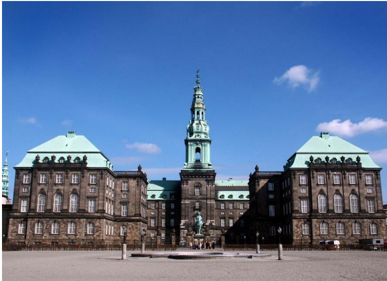
Slika 10. Palača Christiansborg

je 1928. godine, ali s ovog mjesta kraljevi i kraljice vladaju stoljećima. Danas palaču koristi kraljica za službene događaje poput svečanih banketa (Kongelige Slotte, 2023).