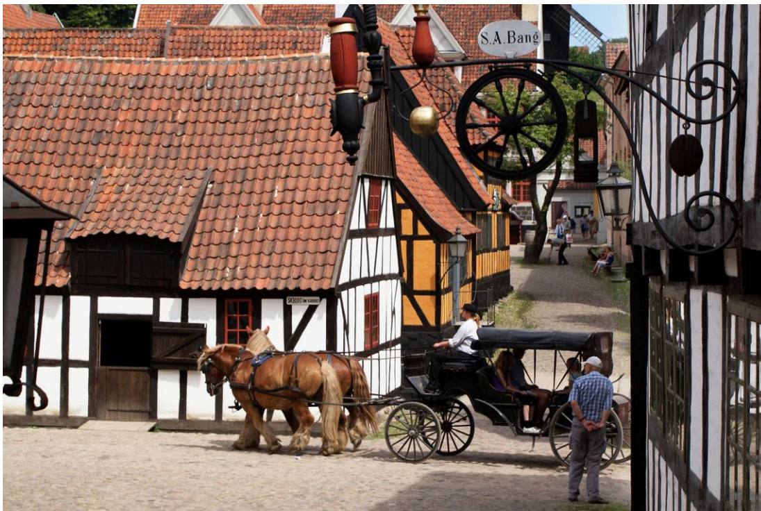
Slika 16. Den Gamle By

Nacionalni je muzej urbane povijesti i kulture na otvorenom u Aarhusu s tipičnim povijesnim starim gradskim zgradama od 1700-ih do sredine 1970-ih. Osim povijesnih kuća i apartmana u odjelu iz 1974. godine, postoji više od 34 radionice i trgovine, kao i ljekarna, škola, pošta, telefonska centrala, jazzbar i još mnogo toga. Nadalje, muzej ima svoje kazalište, kazalište Elsinore, koje se koristi za operu, komorne koncerte, festivale itd (Den Gamle By, 2023).