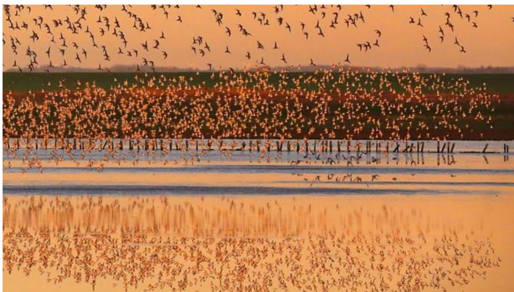
Slika 4. Nacionalni park Vadehavet