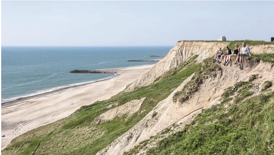
Slika 7. Geopark Zapadni Jylland

broju radnih mjesta. Važno je napomenuti da primarni sektor sa šumarstvom, poljoprivredom i ribarstvom zapošljava 7% -14% radne snage, što je mnogo više od nacionalnog prosjeka od 4% za ovaj sektor (UNESCO, 2023).