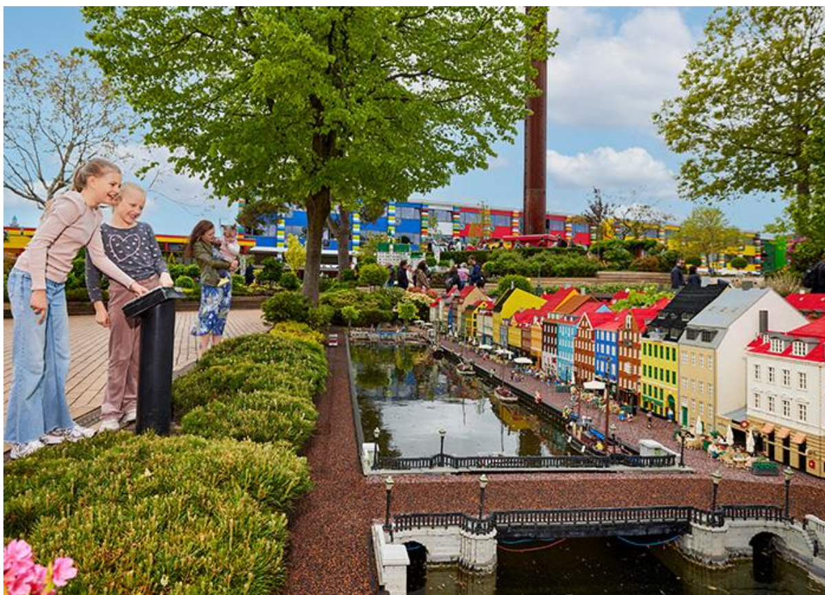
Slika 18. Legoland