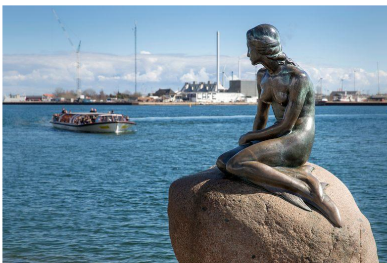
Slika 13. Mala Sirena

Mala sirena je nekoliko puta bila žrtva vandalizma. Dva puta je izgubila glavu, nakon što je ruka otpiljena, i nekoliko puta joj je izlivena boja, no svaki put je restaurirana i vraćena na pristanište Langelinie (Visit Copenhagen, 2023).