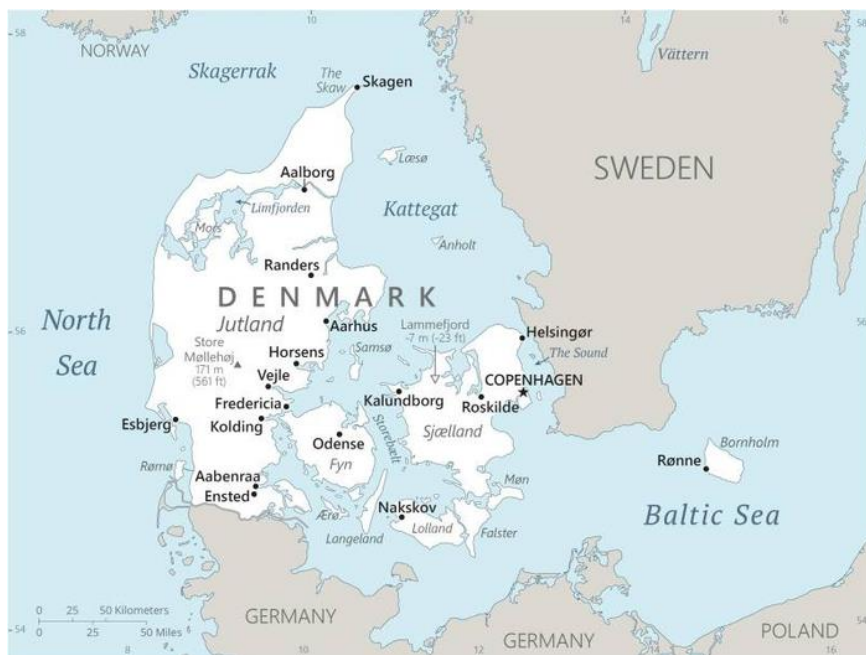
Slika 1. Prikaz Danske na karti