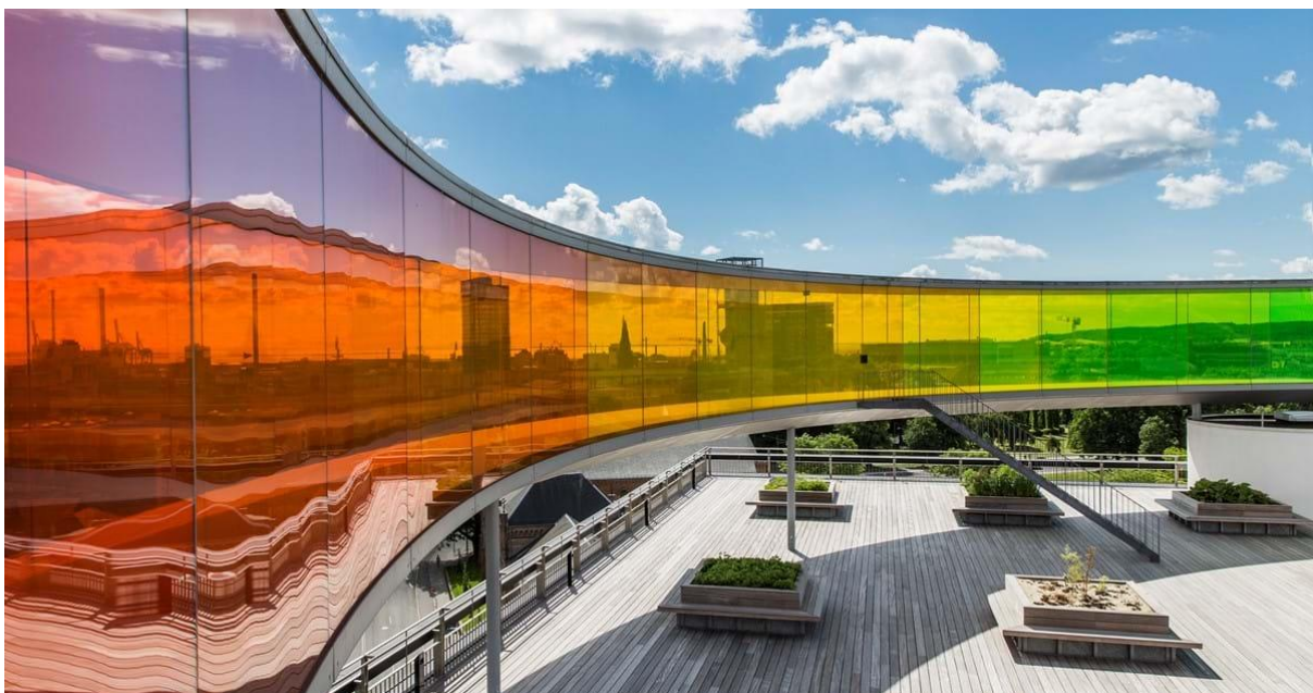
Slika 15. ARoS

S ukupno 20.700 četvornih metara raspoređenih na deset katova, ARoS je jedan od najvećih muzeja umjetnosti u sjevernoj Europi. Svake godine ARoS ima oko milijun posjetitelja, što ga čini najposjećenijim muzejom umjetnosti u Sjevernoj Europi. ARoS sadrži četiri prostrane galerije, galeriju ARoS Focus i kat s instalacijskom umjetnošću. U svakoj od ovih galerija ARoS predstavlja umjetnost iz muzejske zbirke ili nacionalnih i međunarodnih umjetnika, uključujući Graysona Perrya, Roberta Mapplethorpea, te Joanau Vasconcelos. ARoS je poznat po kružnoj šetnici dugine panorame na njegovom krovu (ARoS, 2023).