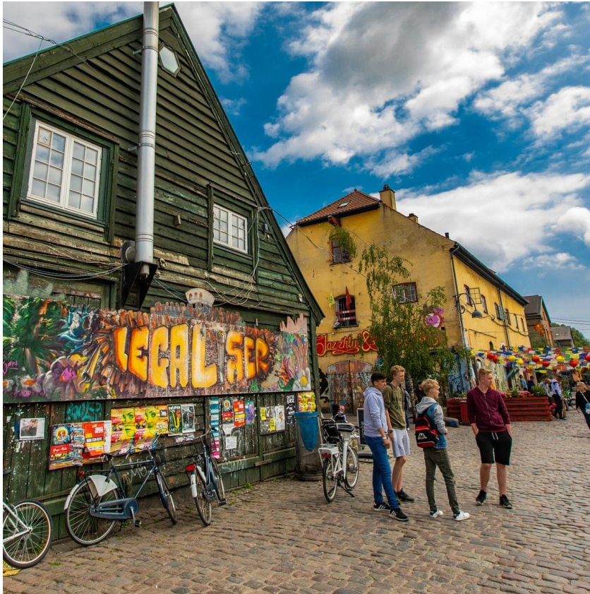
Slika 21. Christiania

Christianije, 2011. godine je sklopljen sporazum, što je značilo da je 1. srpnja 2012. osnovana zaklada Slobodan Grad Christiania. Zaklada je sada vlasnik cijelog dijela Christianije smještenog izvan zaštićenog bedema i daje u zakup zgrade i zemljište na bedemima, koja su još uvijek u vlasništvu države (Visit Copenhagen, 2023.)