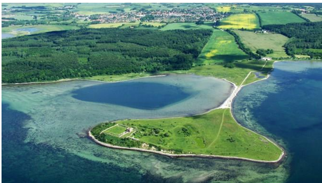
Slika 3. Nacionalni park Mols Bjerge