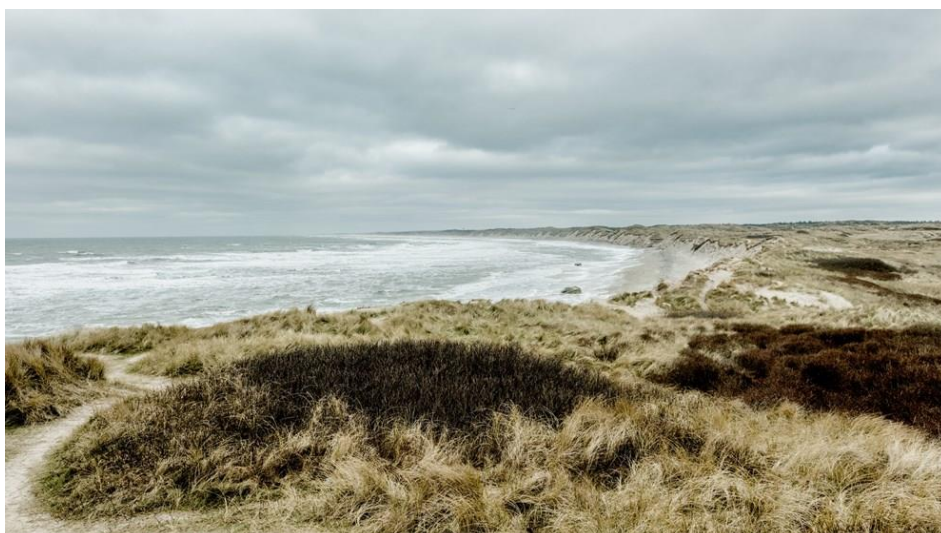
Slika 2. Nacionalni park Thy