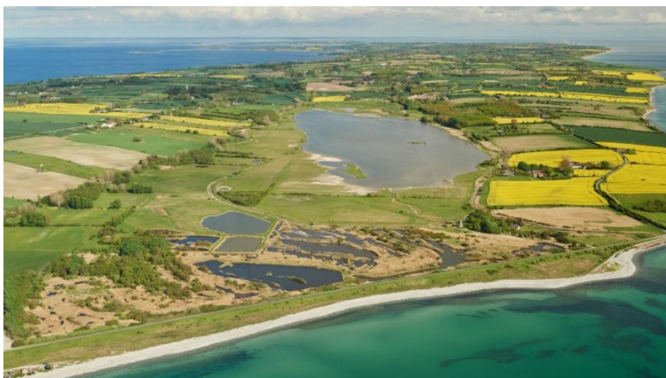
Slika 9. Geopark arhipelag Južni Funen (Izvor: www.visitaeroe.com , 2023)