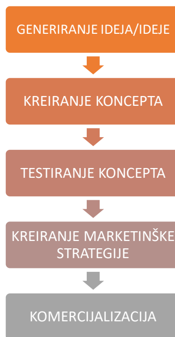
Slika 2. Faze razvoja novog proizvoda

Sve počinje idejom. Ideja je, u ovom slučaju, prijedlog, zamisao ili pak nadahnuće i poticaj da se nešto napravi, da se određena misao uobliči u proizvod. Na temelju ideje kreira se koncept, koji podrazumijeva skicu odnosno oblikovanje ideje u određenu formu, određeni sadržaj koji se strukturira na točno određen način. Taj koncept potrebno je testirati, kako bi se ustanovilo koje su njegove prednosti i nedostaci, odnosno kako bi ga se usavršilo. Kada je koncept razvijen, odabire se i kreira adekvatna marketinška strategija, a potom slijedi komercijalizacija proizvoda, odnosno uvođenje komercijalnih metoda u poslovanje i prilagođavanje uvjetima ciljane prodaje.