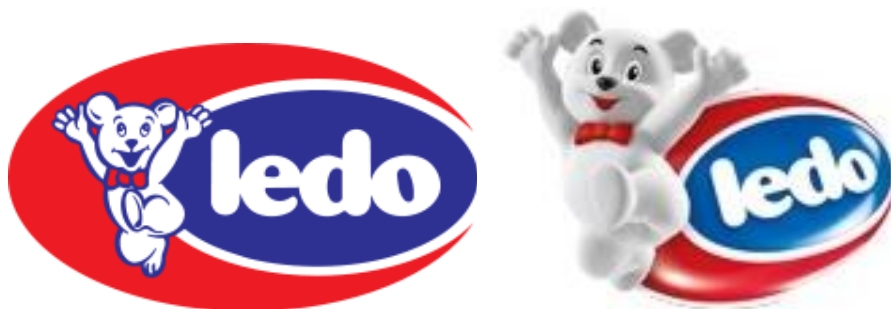
Slika 3. Stari i modernizirani logotip kompanije Ledo