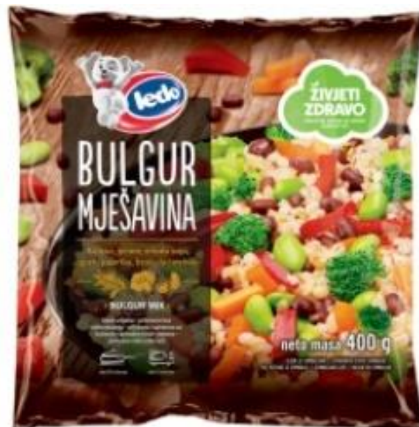
Slika 5. Ledo Bulgur mješavina