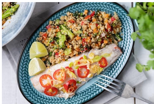
Slika 7. Fotografija uz Ledov recept kojim promovira smrznutu ribu i Quinoa mješavinu