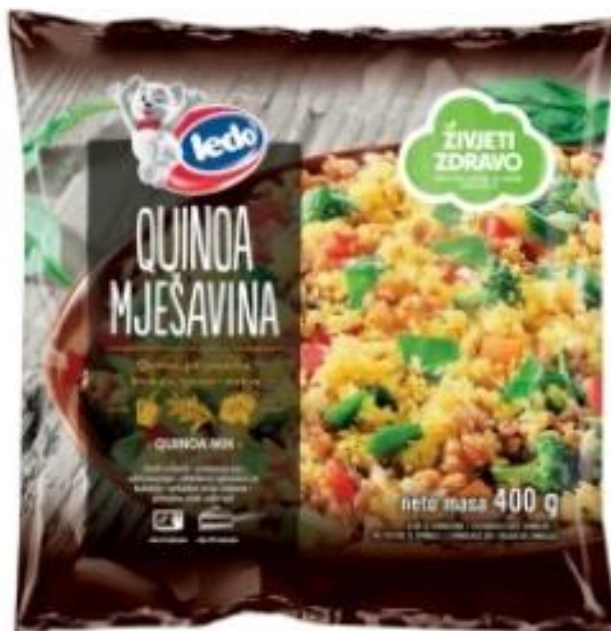
Slika 4. Ledo Quinoa mješavina