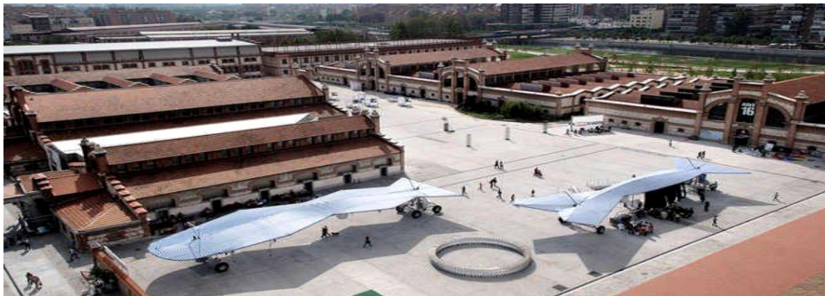
Slika 3. Matadero – centar kulture