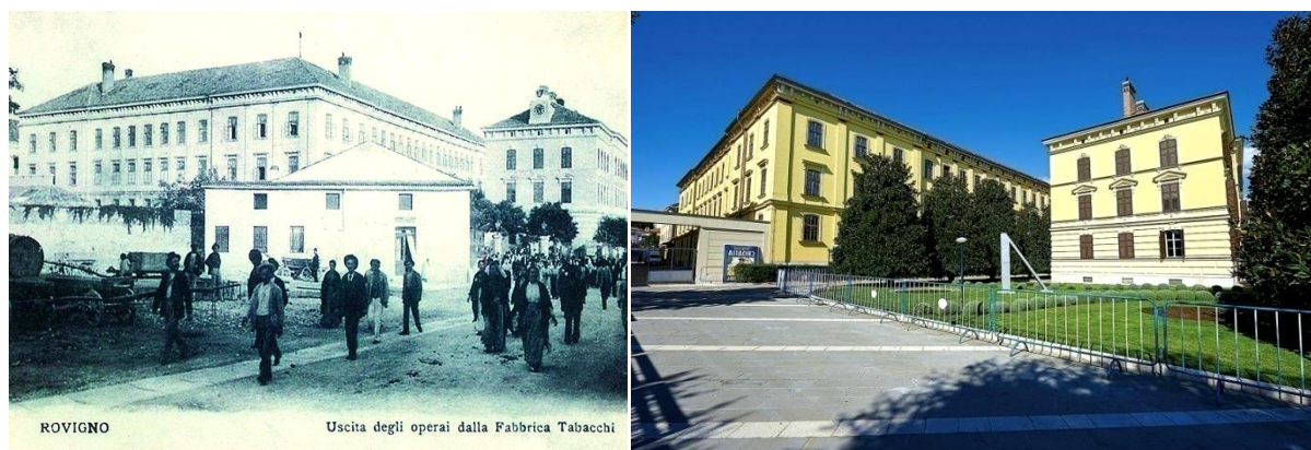
Slika 7. Tvornica duhana prije obnove (lijevo) i nakon obnove (desno)