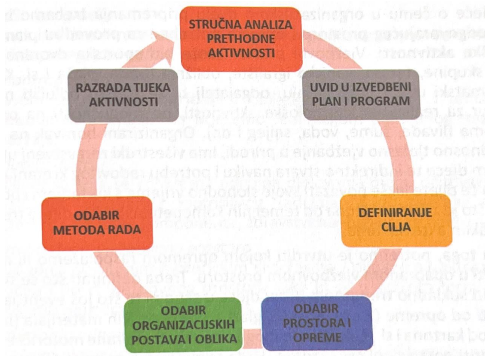
Slika 2. „Postupci organizacijskog pripremanja odgajatelja za kineziološke aktivnosti“ (Petrić, 2019: 131)

„Organizacijsko pripremanje odgajatelja za kineziološke aktivnosti odnosi se na metodičku pripremu za realizaciju tjelesnog vježbanja tijekom jedne konkretne aktivnosti. Može se sagledati putem sljedećeg skupa smisleno povezanih postupaka odgajatelja: stručna analiza prethodne aktivnosti, uvid u izvedbeni plan i program, definiranje cilja, odabir prostora i opreme za tjelesno vježbanje, odabir organizacijskih postava i oblika, adekvatnih metoda rada te razrada tijeka aktivnosti.“ (Petrić, 2019: 130).