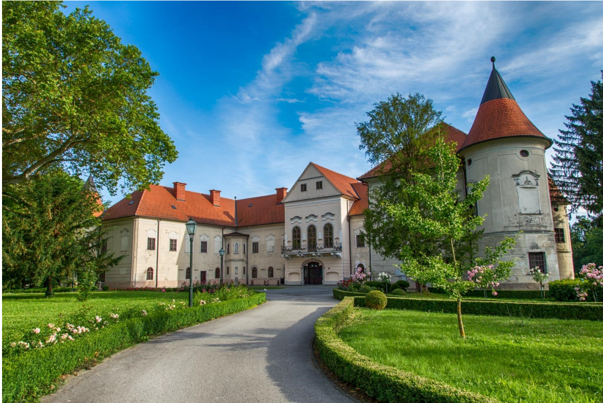
Slika 9. Dvorac Lužnica