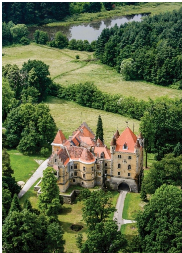
Slika 5. Dvorac Maruševec