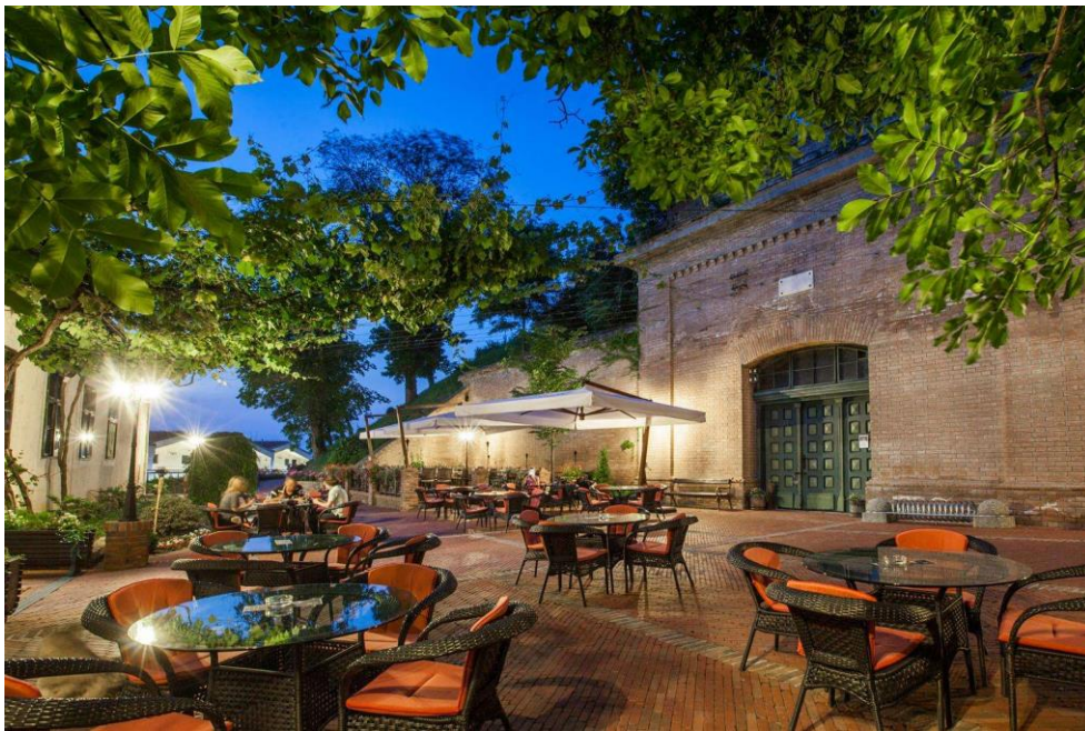
Slika 2. Iločki podrumi