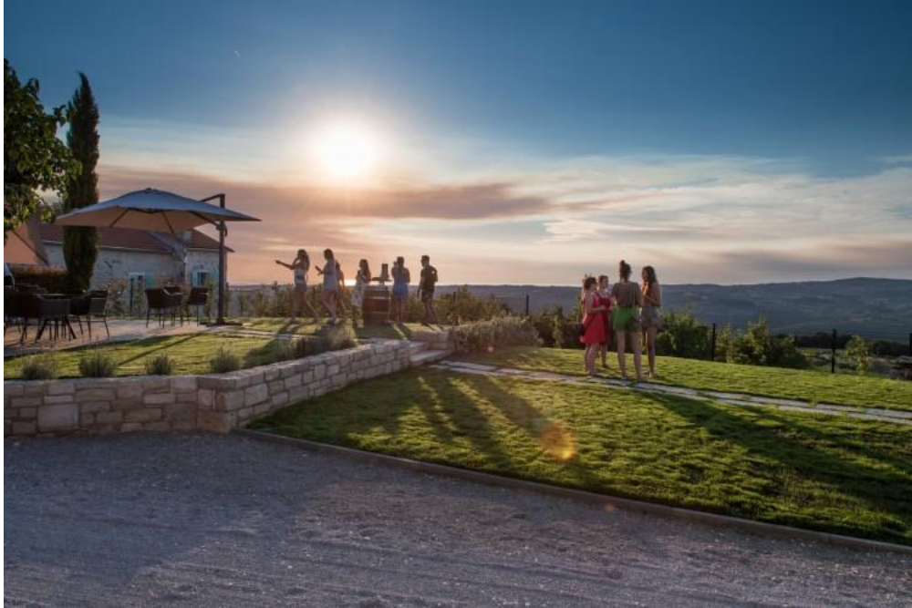
Slika 4. Vinarija Rossi