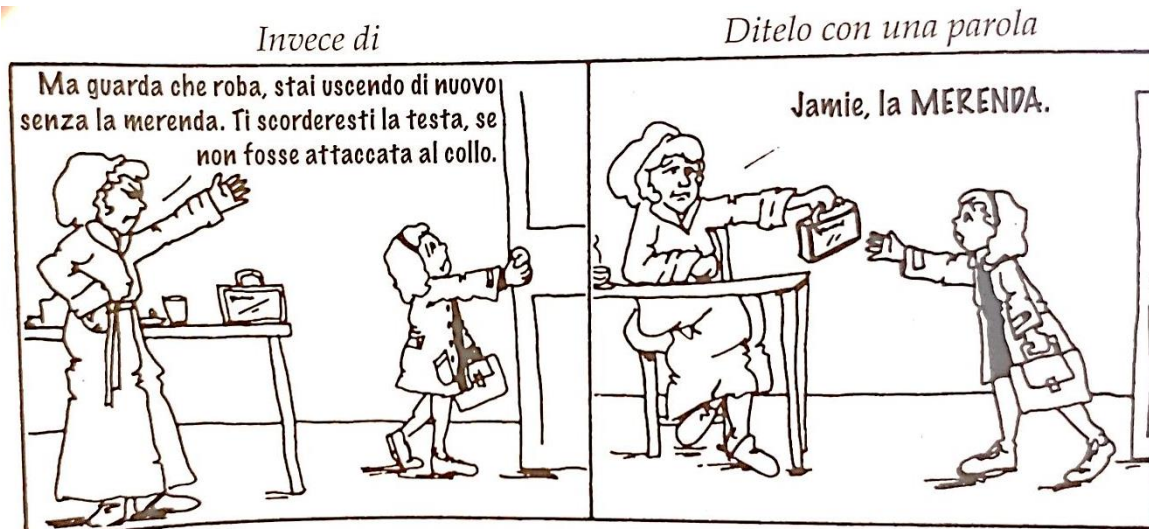
Figura 2: “dillo con una parola” (Faber, Mazlish, 2014: 59)

Le vignette soprastanti, tratte dal libro di Faber e Mazlish, rispecchiano delle tipiche situazioni quotidiane nelle quali il genitore si trova a dover ripetere sempre la stessa indicazione per l'ennesima volta. Come già detto in precedenza, i messaggi inviati ad un pubblico infantile devono essere semplici e diretti. La complessità e la lunghezza delle ramanzine sviano l'attenzione del bambino da quello che è il succo del messaggio, aggiungendoci anche sentimenti poco piacevoli quale la noia, la delusione, il senso di colpa e il nervosismo. Quindi un'affermazione di poche parole riporta il bambino verso la richiesta dell'adulto e ne favorisce la comprensione (Faber, Mazlish, 2014).