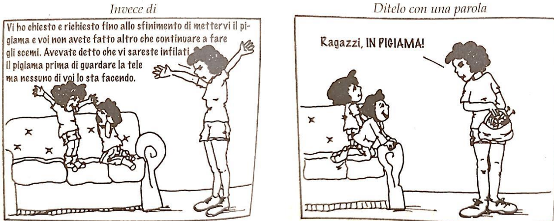
Figura 1: “dillo con una parola” (Faber, Mazlish, 2014: 58)