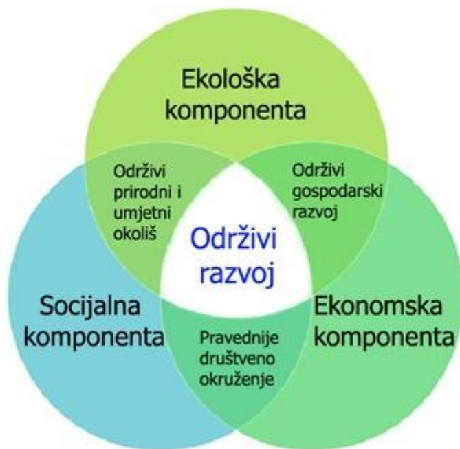
Slika 1. Temeljne sastavnice održivog razvoja