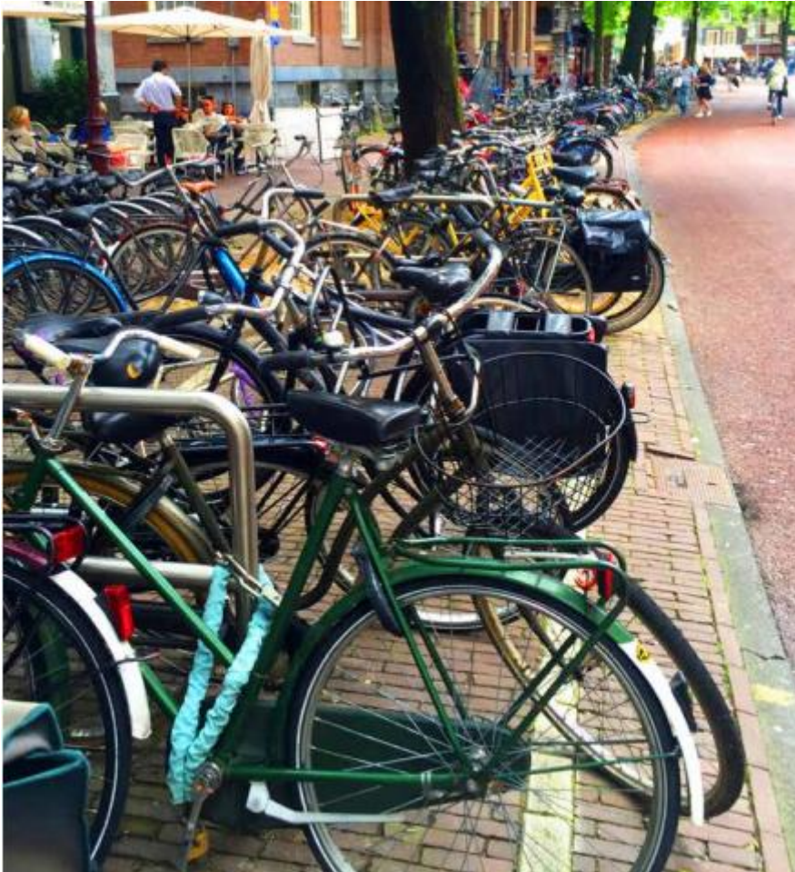
Slika 3. Prenapučenost bicikala turista i lokalnog stanovništva

Izvor: 1. UNWTO (2020): Overtourism? Understanding and Managing Urban Tourism Growth beyond Perceptions, dostupno na https://www.e-unwto.org/doi/pdf/10.18111/9789284420070 , pristupljeno 08.04.2021.